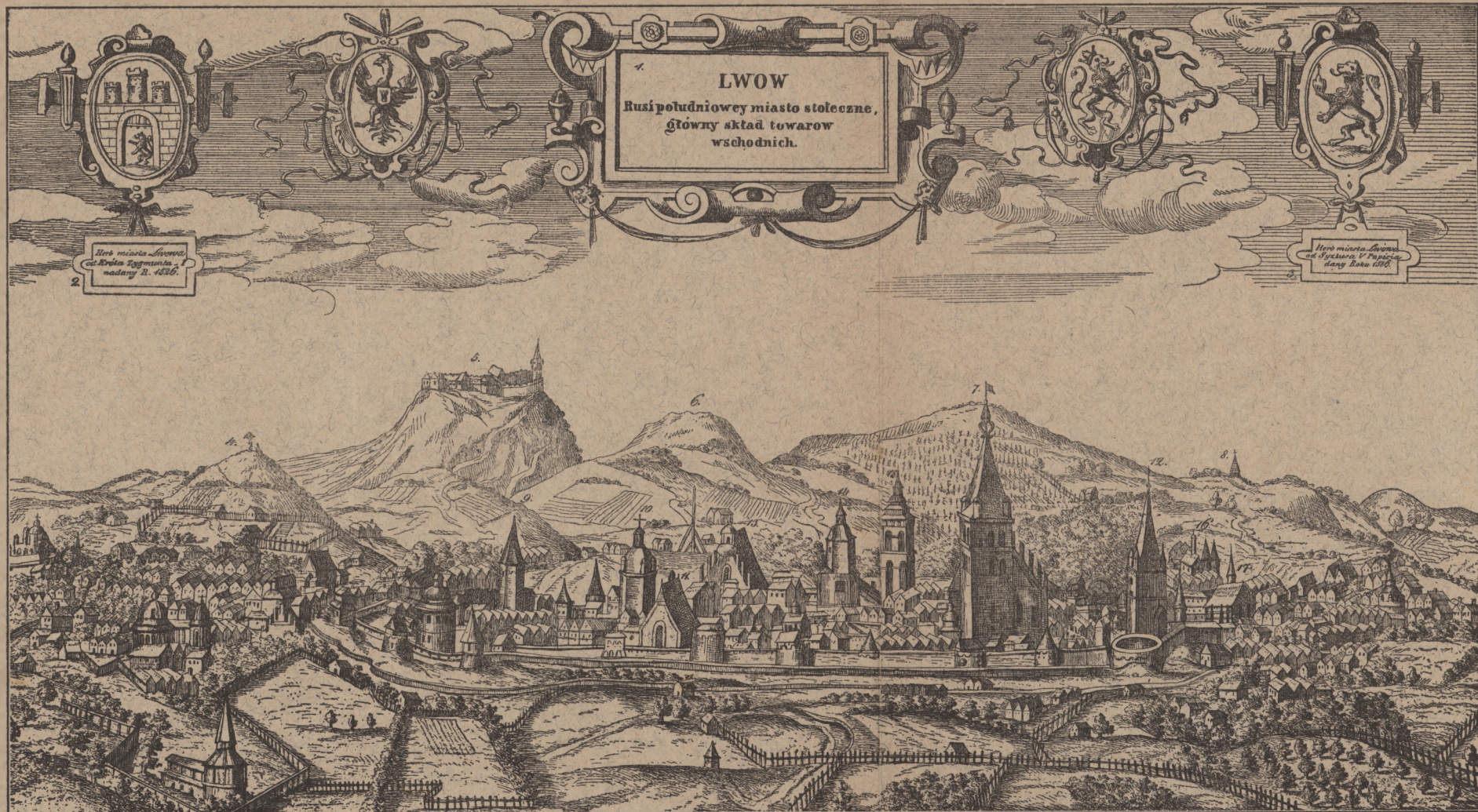
4. ŁYSA GÓRA. – 5. WYSOKI ZAMEK, KTÓRY PRZY DNIU POGODNYM O 10 MIL OD LWOWA WIDAĆ. – 6. GÓRA SZCZEPANA POSPOLICIE LWIA ZWANA. – 7. KOŚCIÓŁ KATEDRALNY P. MARYI. – 8. CERKIEW RUSKA ŚW. KRZYŻA. – 9. BRAMA KRAKOWSKA. – 10. KOŚCIÓŁ ORMIAŃSKI. – 11. FRANCISZKANIE. – 12. BRAMA HALICKA. – 13. DOMINIKANIE. – 14. RATUSZ. – 15. WIEŻA STAUROPIGIALNA RUSKA. – 16. KOŚCIÓŁ Ś. ANDRZEJA. – 17. KARMELICI. – 18. PANNA MARYA.