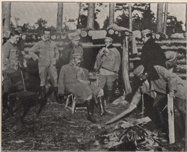
KOMENDANT W OKOPACH NA WOŁYNIU.