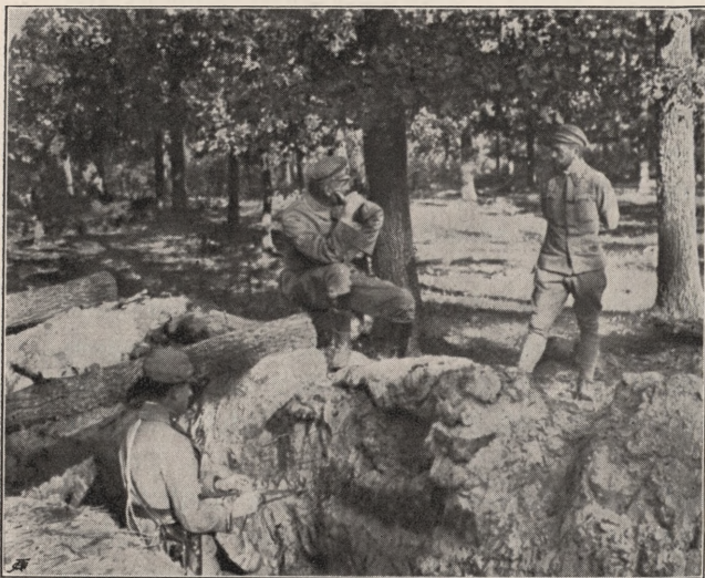
KOMENDANT W OKOPACH NAD STYREM W CZEBENIU.