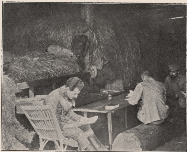
KWATERA KOMENDANTA PIŁSUDSKIEGO W KOŁKACH NAD STYREM.