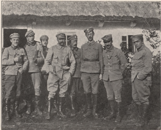
KOMENDANT PRZED SWĄ KWATERĄ.