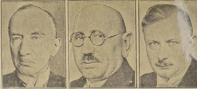
Teodor v. Guérard minister sprawiedliwości