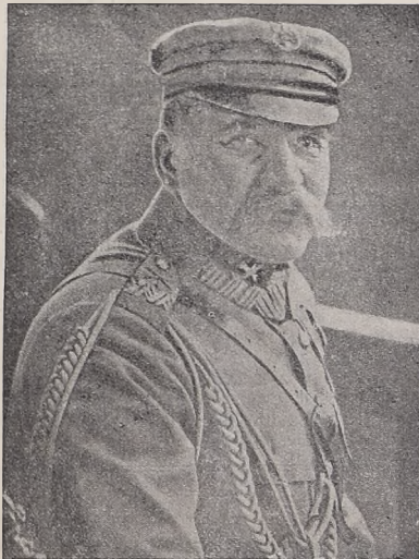
Komendant w czerwcu 1927 r.

Tak więc wywiezieniu Komendanta stało się pierwszym węzłem złączenia się całego Narodu do walki z zabórcami.