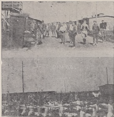
Z życia w obozie w Szczypiornie.

kiedykolwiek munduru legionowego, który obowiązywał w Legionach przed przysięgą, mogło być zastosowane wobec oficerów jedynie za czyny niehonorowe. Gdyby rozkaz ten był prawnym stanowiłby płamę na naszym przyszłym życiu. Pod żadną presją nie