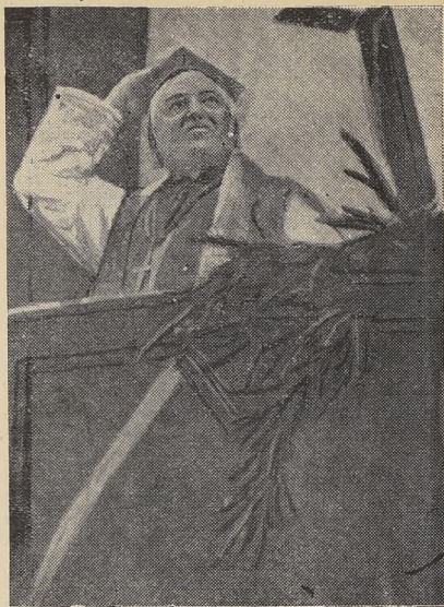
Ks. Biskup Bandurski w czasie przemowy w Wilnie.

wielki człowiek legiony, które niczem innym nie były, tylko tym atutem politycznej myśli, jedynie rebelie mówiącym więcej, aniżeli dyplomacja przy stole