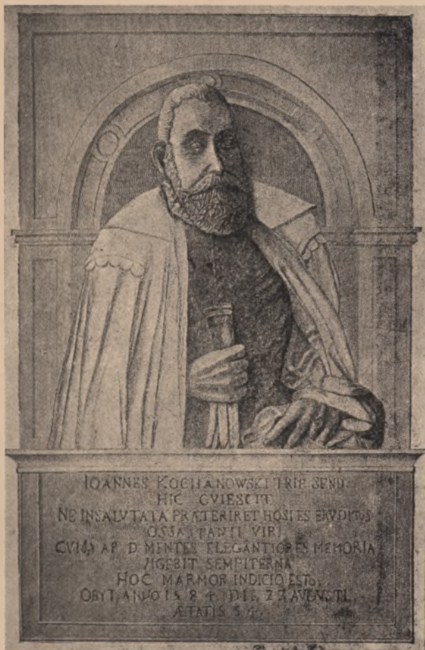
Portret Jana Kochanowskiego (plaskorzeźba na nagrobku poety w Zwoleniu).

„Tu Ronsarda na lutniej któren grał ojczystej widziałem... I słuchałem go pełen zdumienia, jakgdybym słyszał mury Theb poruszające onego przesławnego Amphiona pienia...” (tł.).