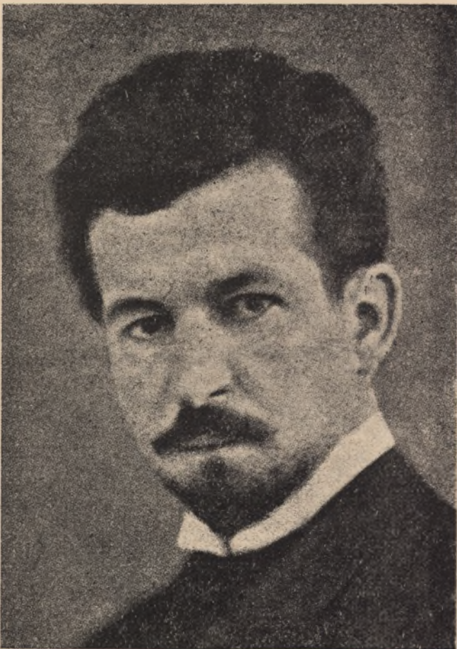
Ś.p. Władysław Orkan.

Odrzuca pokusy piękna, zwodnicze blaski „czystej sztuki”, w czasach jego młodości literackiej tak modne.