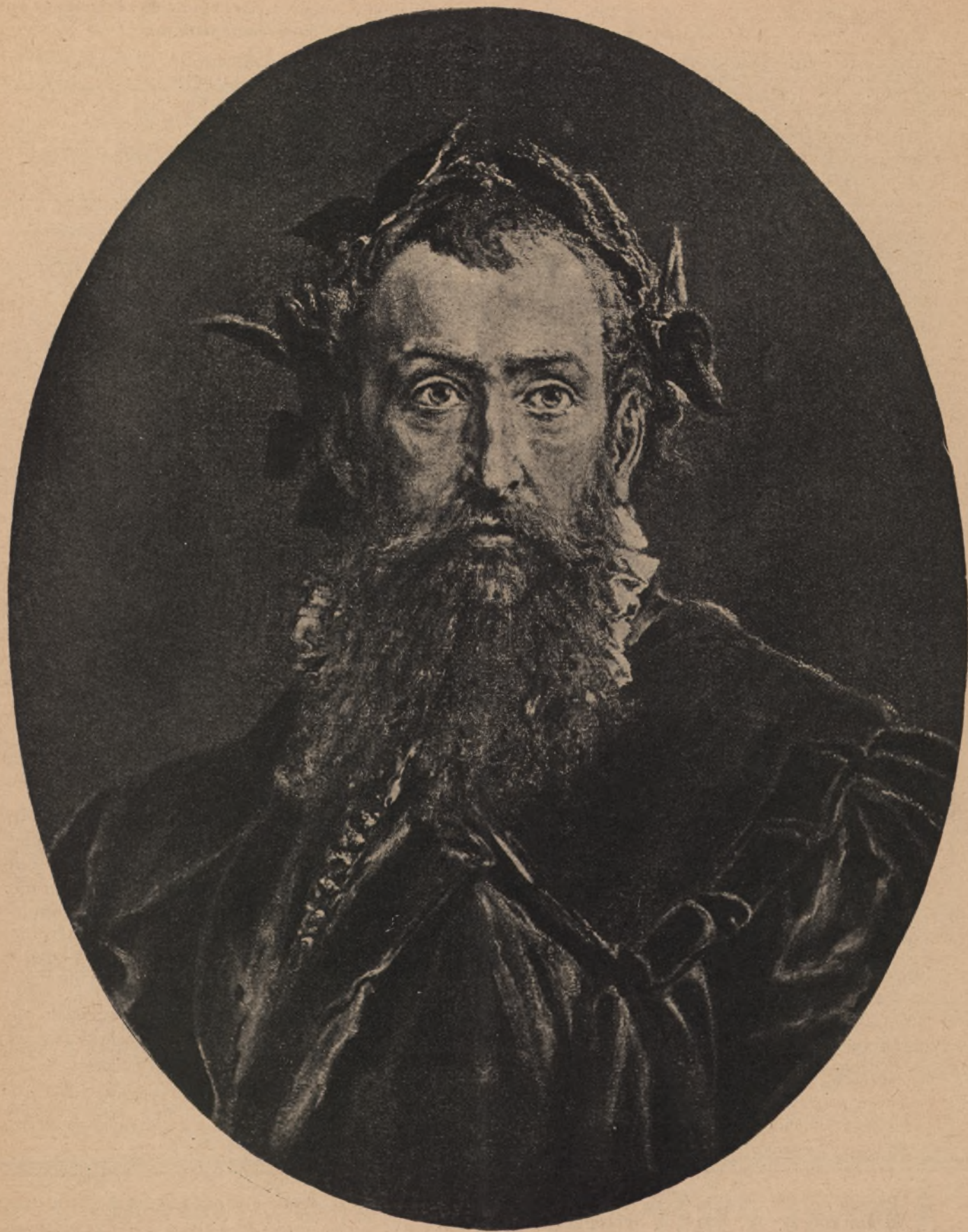
JAN KOCHANOWSKI 1530—1930