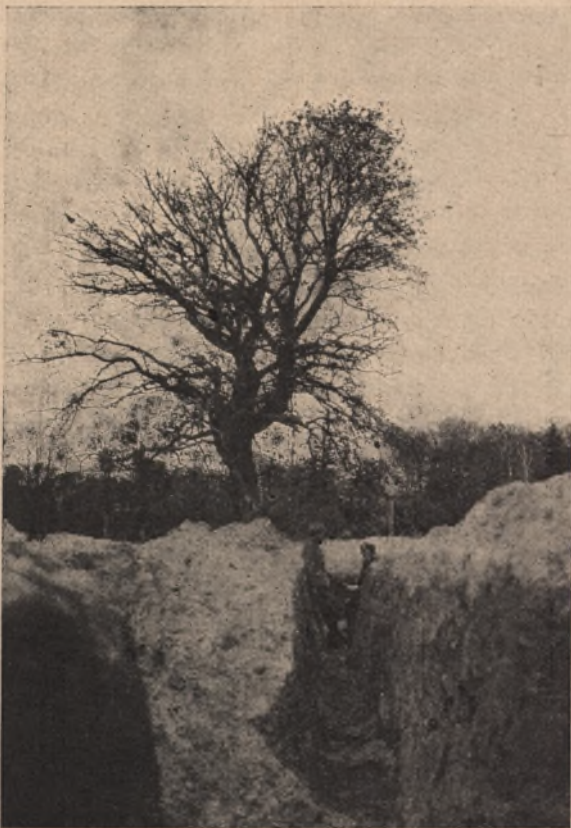
Włokopach na Polskiej Górze.

Z nazwiskiem Wincentego Nowina Smągłowskiego, twórcy zagadkowego spisku koronacyjnego w Warszawie w r. 1829, spotkałem się w czasie porządkowania biblioteki miejskiej w Stanisławowie przed 23-ma laty, która jemu zawdzięcza swoje istnienie. Mianowicie na jednej z książek bibliotecznycy znalazłem własnoręczną notatkę Smągłowskiego, w której swoje aresztowanie w roku 1829, w czasie koronacji cara Mikołaja w Warszawie, szczególnie podkreślił, zaznaczając, że został aresztowany przez Nowosilcowa a następnie władzom austriackim wydany. W tym