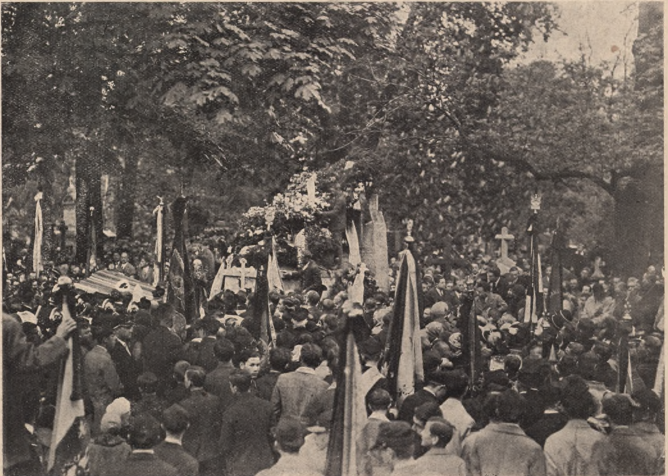
Manifestacyjny pogrzeb ś. p. Władysława Orkana na cmentarzu rakowickim w Krakowie dnia 16 maja b. r.

jący sobą wiele miejsca, jakąś naturalną skromnością, prostotą i życzliwym, a żywym wejrzeniem, na wstępie zjednujący... Te cechy uczyniły go od razu kimś swoim, domowym, wyznaczając miejsce przy naszym rodzinnym stole, jakby zajmowane oddawna. Jednocześnie nas zresztą i wojenne przeżycia, na wspólnym podłożu ideowym, choć słowami nietykane prawie, a przecie wciąż obecne — i w tym wzroku, jakim po-