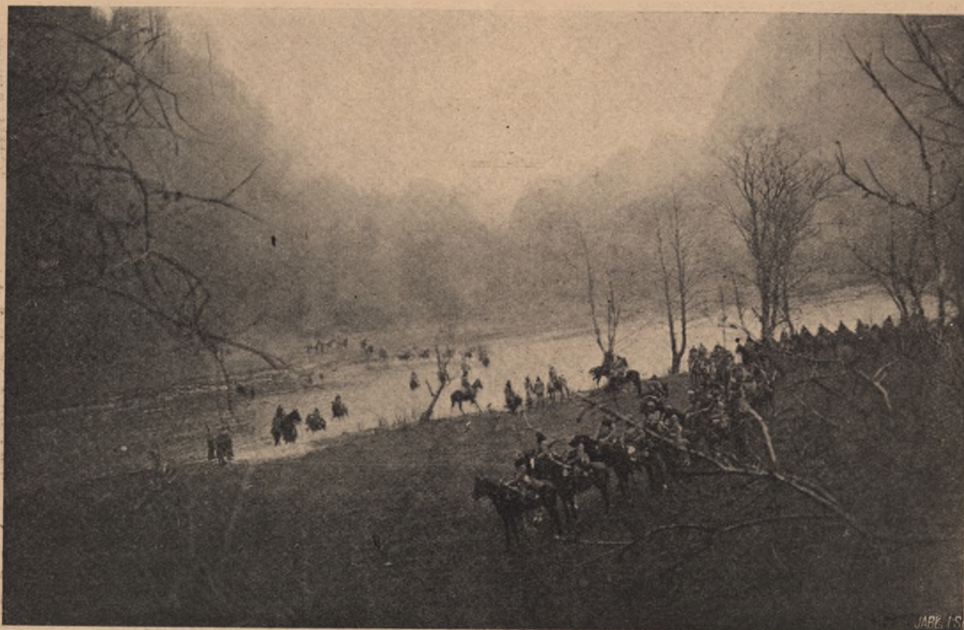
Włani II. Brygady Leg. Pol. w Karpatach.

Wielka wojna, rozpoczęta w r. 1914, wywołała wzrost cen, który nie skończył się z chwilą zawieszenia broni w r. 1918. Pod naciskiem stosunków wojennych ceny drożały jeszcze w ciągu r. 1919. Przesilenie w Stanach Zjednoczonych w maju 1920 r. stało się punktem zwrotnym w dziejach ruchu cen. Z tą chwilą rozpoczyna się zniżka cen, która jednak nie ma cha-