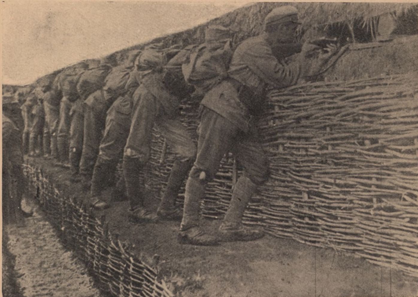
W okopach na Besarabji.

Legjonista, odchodząc jako ranny lub chory do szpitali węgierskich, nie posiadał nieraz nawet takich dokumentów, któreby jego przynależność do Legjo-