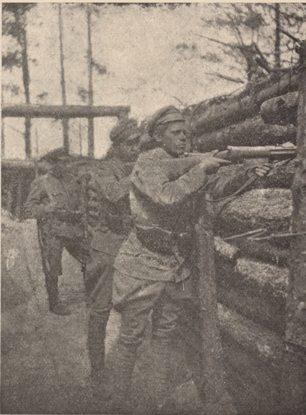
W okopach na Polskiej Górze.