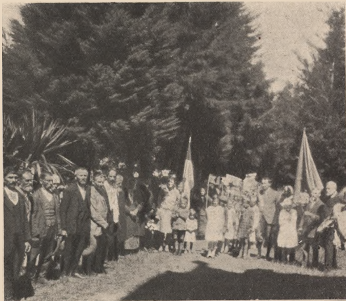
Obchód Imienia Marsz. Piłsudskiego w kolonii polskiej w Brazylii.

— Strasznieśmy radzi, żeście nas wreszcie odwiedzili, mówił, nikt z rodaków tu do nas jeszcze nie zjazał. Bywamy w mieście ale i tak rzadko tylko spotkać można kogoś ze swoich z Polski. Siedzimy tu od dziecka. Teraz tu spokojnie, ale jeszcze lat dziesięć wstecz bywały u nas indiańskie napady. Ojciec wraca z pola do domu, a tu ani żywej duszy. Wszystko co w domu zostało, starzy, kobiety i dzieci — pomordowane. Zbieramy się i my szukać rabusiów w ich osadzie, było nas więcej i dobrze uzbrojonych to też i my nie przepuściliśmy nikomu. Wynieśli się dalej i teraz zupełnie już spokojnie.