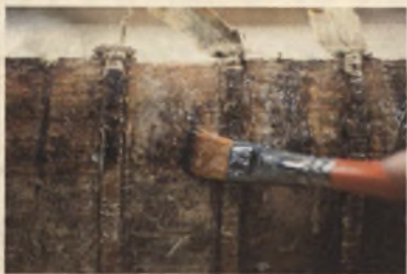
Starodruk 45 st., New Vermehte..., 1625, oczyszczanie grzbietu z kleju.