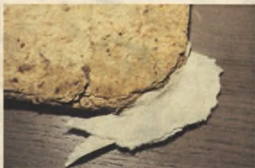
Starodruk 45 st., New Vermehte..., 1625, stan w trakcie konserwacji, uzupełnianie tektur.