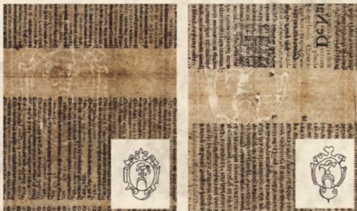
Stan druk 1315 st., II, Powodowski, Christologiae , 1602 – stan przed konserwacją. Zdjęcie w świetle przechodzącym z widocznymi znakami wodnymi. Filigrany papierni w Młodziejowicach.

Hieronim Powodowski (1543 lub 1547 - 1613) był teologiem, kanonikiem poznańskim, gnieźnieńskim i krakowskim, a także pisarzem religijnym, autorem licznych pism polemicznych przeciw braciom polskim.