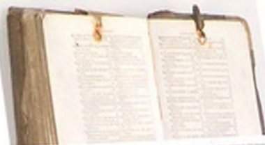
Stronka 1822 st. Conciones in evangelia... 1568. Dobra okładka z metalowymi klamkami i metalowymi przegródkami.