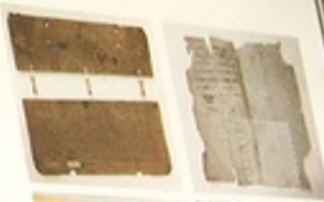
Stronka 1822 st. Conciones in evangelia... 1568. Dobra okładka z metalowymi klamkami i metalowymi przegródkami.