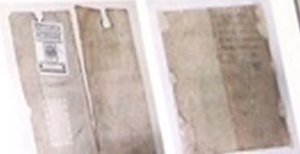
Stronka 1822 st. Conciones in evangelia... 1568. Dobra okładka z metalowymi klamkami i metalowymi przegródkami.