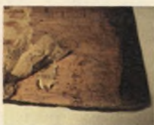
Starodruk 703 st., Leges Sae Statuta... 1551, odbrązowienie wraz z początkiem odkształceń, stan w trakcie konserwacji.