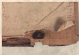
Starodruk 1822 st., Conciones in evangelia ... 1568 . Uszkodzony brzeg desek oprawy.