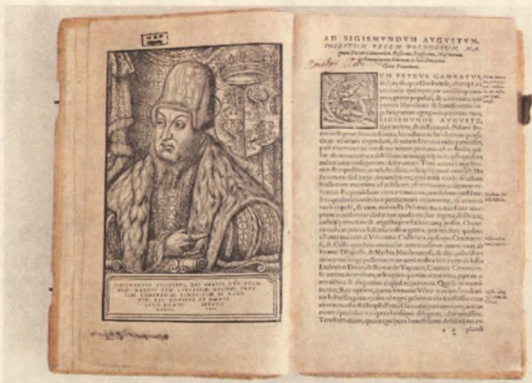
Starodruk 1397 st., De origine et rebus... , 1555 – tuż po konserwacji.

i wszystkich innych potocznościach koronnych ksiąg XXX”.