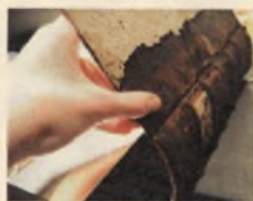
Starodruk 703 st., Leges Sae Statuta... 1551, próba odnowy w trakcie odbrązowienia.