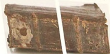
Stronka 1822 st. Conciones in evangelia... 1568. Dobra okładka z metalowymi klamkami i metalowymi przegródkami.