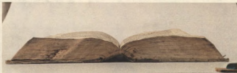
Starodruk 1166 st., Constitucye koronne..., 1685 – stan przed konserwacją, otwarta księga, dolne obcięcie.