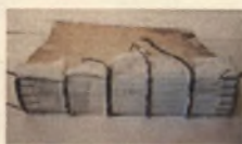
Starodruk 703 st., Leges Sae Statuta... 1551, próba po zakończeniu.