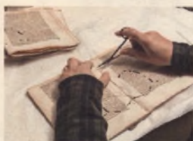
Starodruk 241 str., Polonia Suspirans, 1656 – w trakcie rozczyszczania sytyki.

Na karcie tytułowej druku znajduje się pieczętka prostokątna z napisem: "Z Duplikatów Biblioteki XX Czartoryskich"