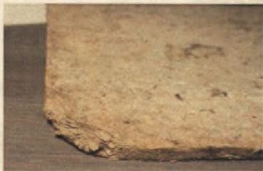
Starodruk 45 st., New Vermehte..., 1625, stan przed konserwacją, ubytek w tekturach.