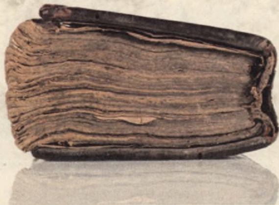
Starodruk 2489 st., P. Newerani, Ozdoba Kościoła..., 1739. Deformacja grzbietu.

Między kartami książki znaleziono święty obrazek i wycinankę w kształcie serca, a także zasuszony kwiatek, które po oczyszczeniu, w kieszonce naklejono od wewnętrznej strony tylnej okładki.