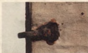
Starodruk 1822 st., Conciones in evangelia ... 1568 . Skródowane okucie służące do zabezpieczenia książki przed kradzieżą

Stan zachowania starodruku przed konserwacją: oprawa - tak skóra, jak i deski okładkowe posiadają ubytki spowodowane przetarciami i żerowaniem owadów, przednia deska złamana jest w połowie; blok książki – karty zabrudzone, głównie w narożnikach, wyklejki osłabione, zaplamione i rozdarte.