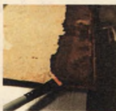
Starodruk 703 st., Leges Sae Statuta... 1551, podłożone fragmenty skóry, stan w trakcie konserwacji.