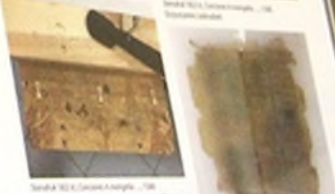
Stronka 1822 st. Conciones in evangelia... 1568. Dobra okładka z metalowymi klamkami i metalowymi przegródkami.