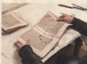
Starodruk 241 str., Polonia Suspirans, 1656 – w trakcie demontażu bloku.