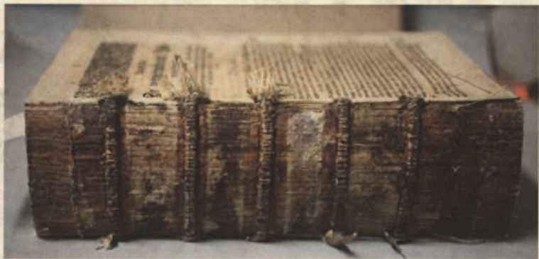
Starodruk 45 st., New Vermehte..., 1625, grzbiet po zdjęciu pasek płótna przed oczyszczeniem.