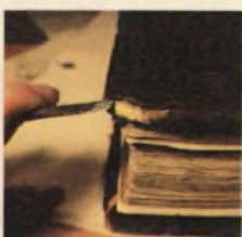
Starodruk 703 st., Leges Sae Statuta... 1551, rozpoczęcie edycji w nowej oprawie.