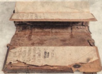
Starodruk 1822 st., Conciones in evangelia ... 1568 . Pęknięte deski oprawy.

Ozdobą starodruku jest oprawa, (pokazywana na okładce informatora) której brązowe skórzane okładki posiadają ślepe tłoczenia, pokrywające całą powierzchnię.