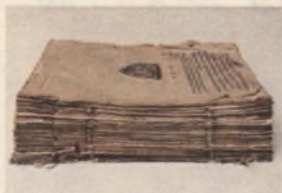
Starodruk 241 str., Polonia Suspirans, 1656 – karty po demontażu.