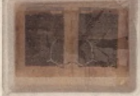
Starodruk 241 str., Polonia Suspirans, 1656 – w trakcie kąpieli wodnych.

Bardzo zły stan zachowania starodruku przed konserwacją: oprawa była destruktem, karty miały mocne przebarwienia w partii tekstu, były przedarte, występowały ubytki (korytarzyki) wydrążone niegdyś przez owady.