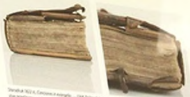
Stronka 1822 st. Conciones in evangelia... 1568. Dobra okładka z metalowymi klamkami i metalowymi przegródkami.

1822 st. TOPIARIUS AEGIDIUS (opracował) CONCIONES in Evangelia et epistolas quae dominicis diebus populo in Ecclesia proponi solent: Ecclesiasticis omnibus moderni temporis summopere utiles, e Tabulis D. Laurentii a Villa Vicentio Xeresani elaboratae, Antverpiae: excudebat Christophorus Plantinus, 1568