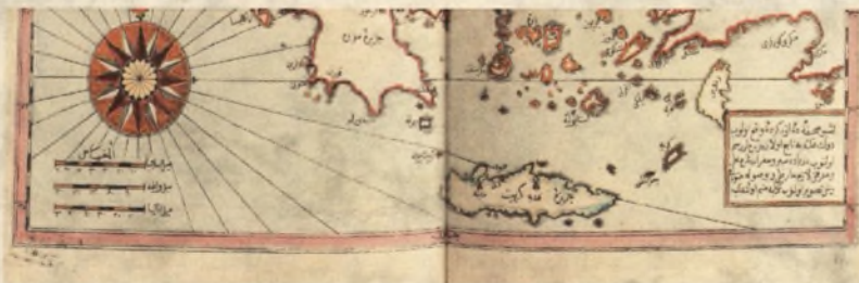
Starodruk 1675 st., Tuhfetü'l-Kibâr fî Esfâri'l-Bihâr, 1728/29 – stan po konserwacji, fragment mapy.

Autor książki - Kâtip Çelebi, pseudonim Mustafy bin Abdullaha (1609 – 1657) był tureckim uczonym, historykiem i geografem, bibliografem i filozofem, uważanym za jednego z najbardziej twórczych autorów niereligijnej literatury naukowej w XVII-wiecznym Imperium Osmańskim. Interesował się kartografią i marynistyką, czego efektem była książka "Historia osmańskiej marynarki wojennej", w której przypomniał zwycięskie kampanie floty tureckiej. Ozdobą dzieła jest pięć dwustronicowych, ręcznie kolorowanych map, wykonanych techniką miedziorytu.