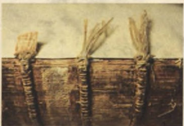
Starodruk 45 st., New Vermehte..., 1625, przedłużenie związów.