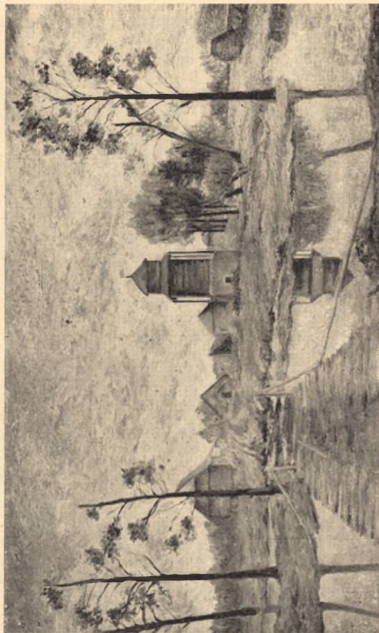
Ogólny widok Żułowa