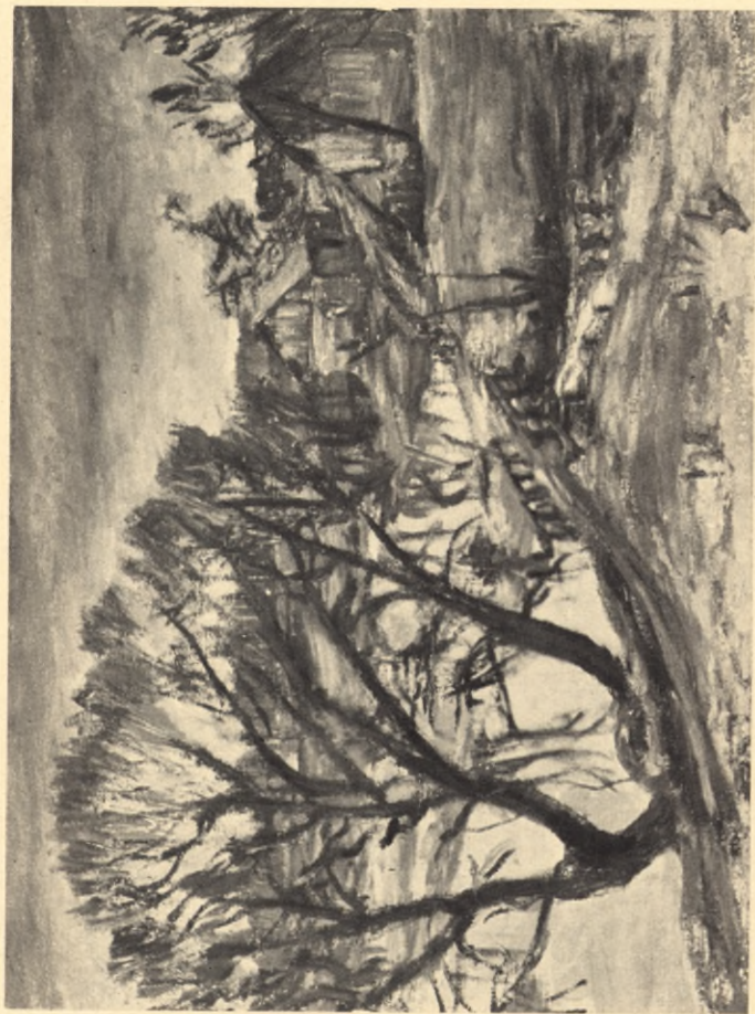
Widok na młyn z piaskowej góry