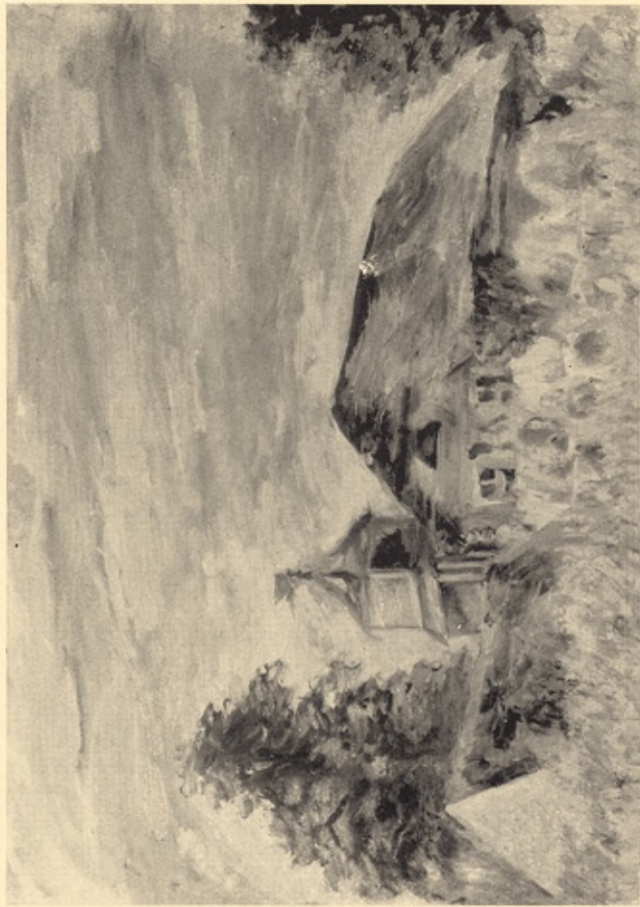
Widok na młyn z piaskowej górki