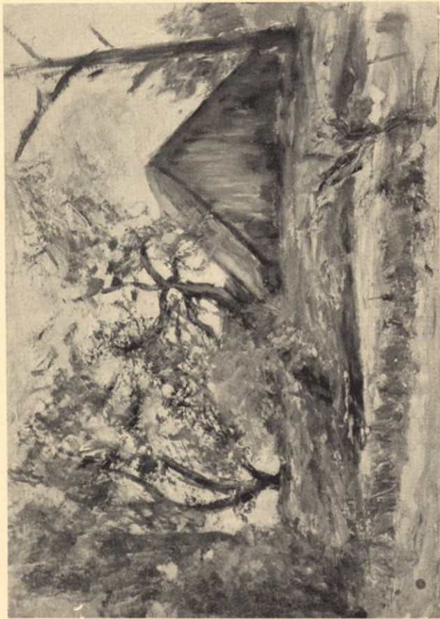
Szopa za rzeką