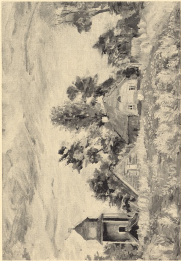
Domek, w którym mieszkał Marszałek po pożarze pałacu