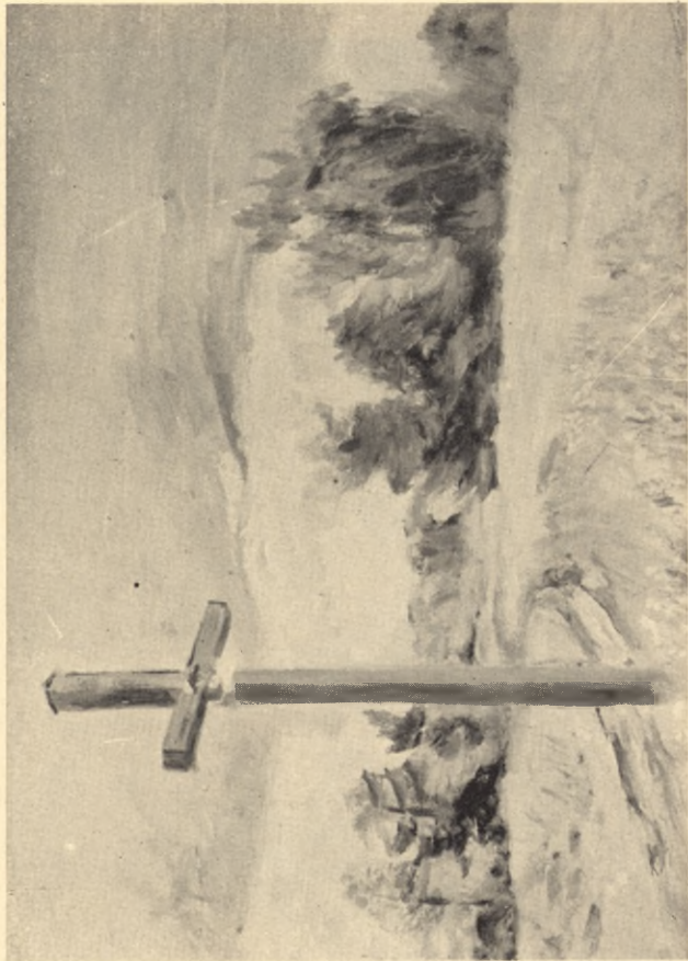
Krzyż w Zułowie (I);