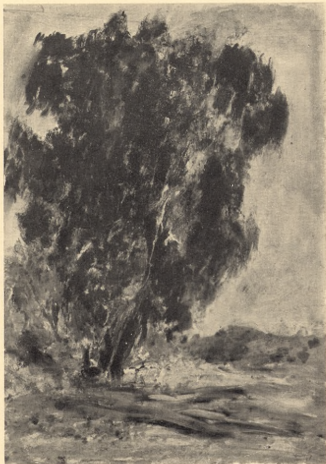
Brzoza pod którą siadywał Marszałek