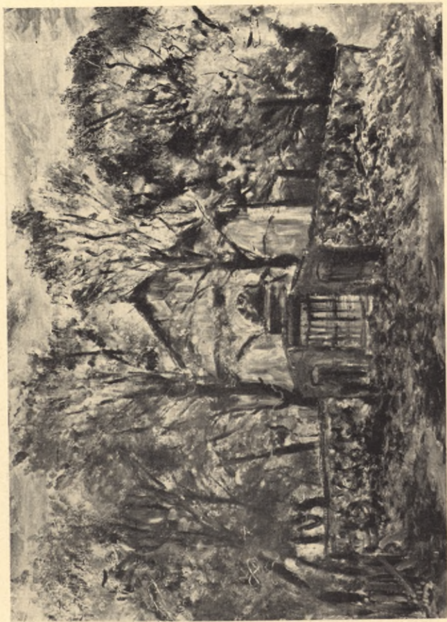
Kościółek w Powiewińcu