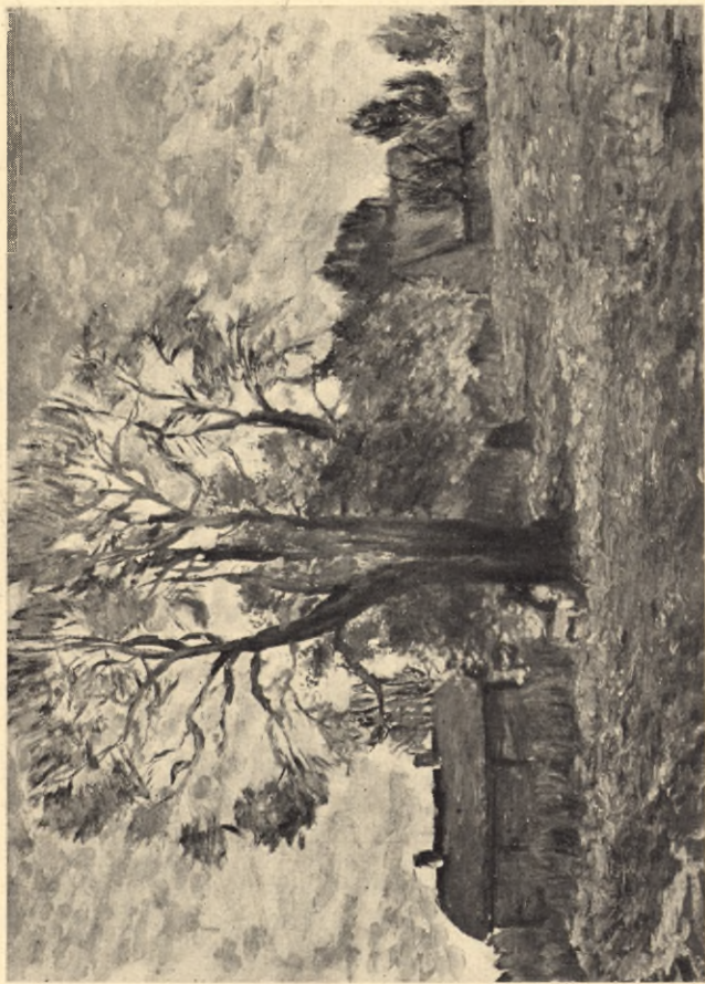
Jesień w Zuloście