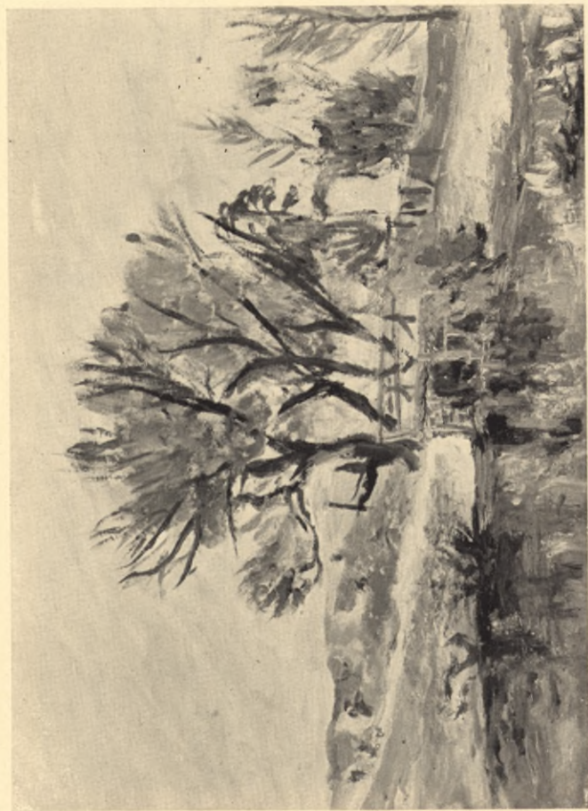
Widok na rzekę Mere