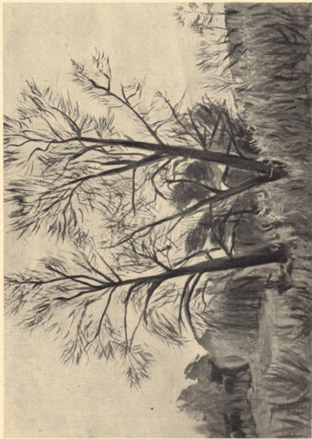
Miejsce dawnego pałacu Piłsudskich