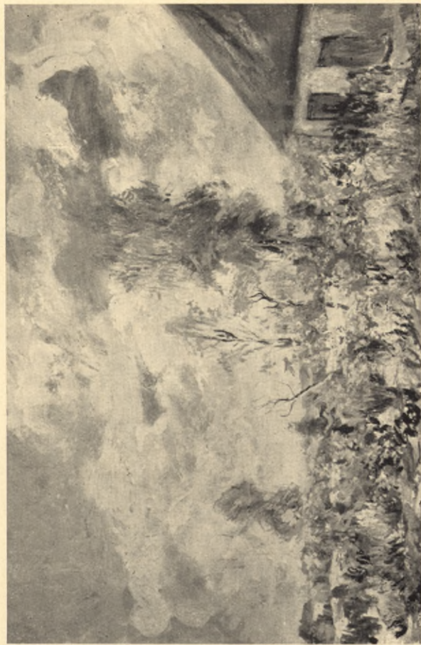
Ogródek koło Czuoraków