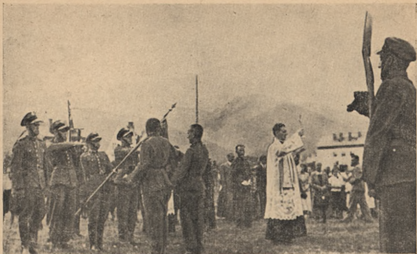
Ślubowanie nowozaciężnych junaków