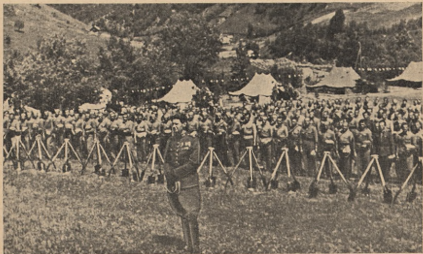
Msza polowa w obozie junackim.