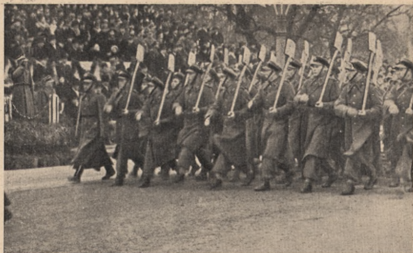
Batalion junaków defiluje przed Marszałkiem Śmigłym Rydzem w dniu święta Niepodległości 11 listopada 1938 r.