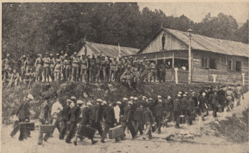
Junacy witają maturzystów przybywających do obozu