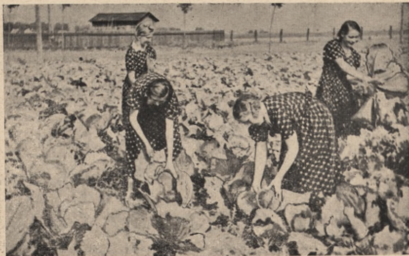
Praca junaczek na roli