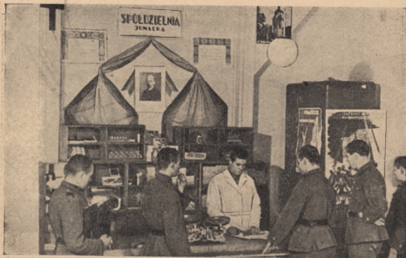
Junacka spółdzielnia spóżywców