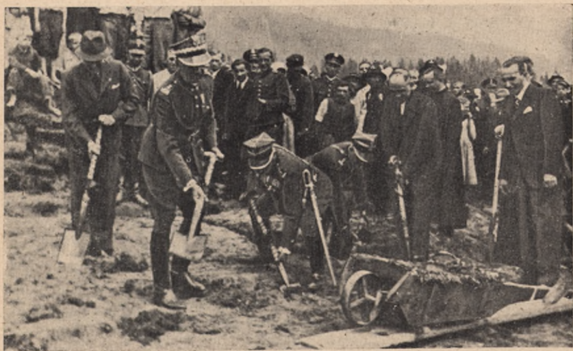
Minister spraw wojskowych na Święcie Pracy bierze czynny udział w pracy junaków