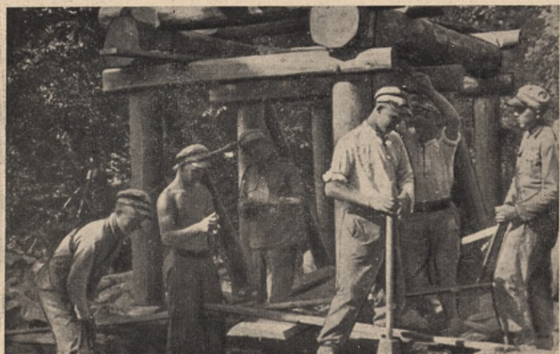
Junacy budują most