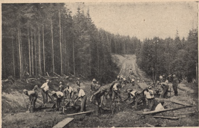
Junacy budują drogę w Karpatach