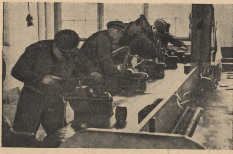
Nauka ślusarstwa w warsztacie fabrycznym