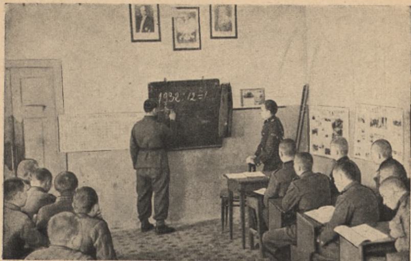
Lekcja w początkowej szkole junackiej