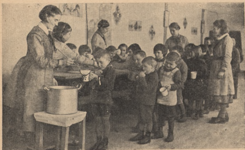
Junaczki dożywiają ubogą dźiatwę