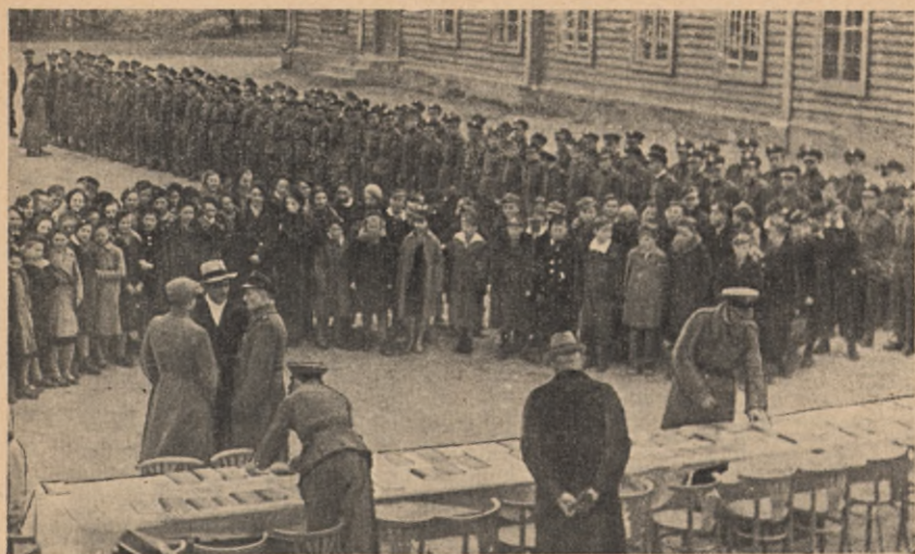
Junacy wręczają szkole powszechnej zakupione przez siebie książki