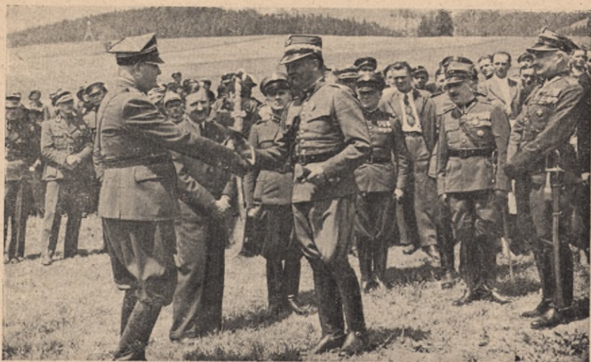
Minister spraw wojskowych przyjmuje z rąk komendanta głównego JHP łopatę przed rozpoczęciem robót junackich w dniu Święta Pracy