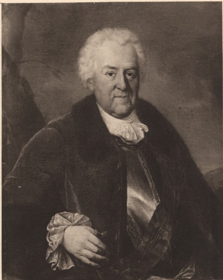
MARCELLO BACCIARELLI Stanisław Poniatowski ojciec króla