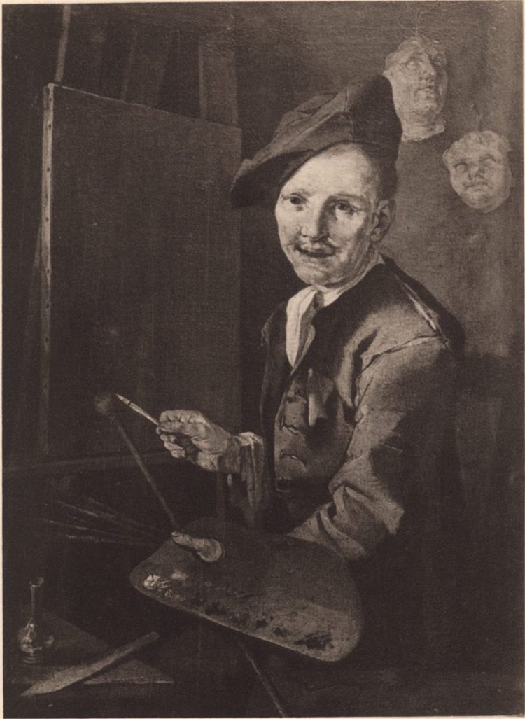
JEAN BAPTISTE CHARDIN