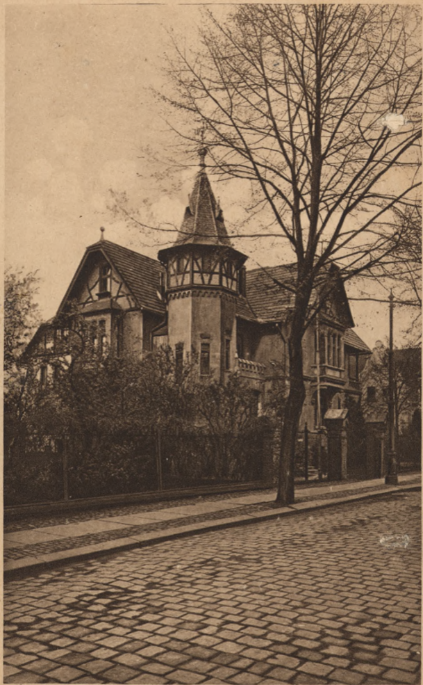
Jesuitenresidenz Appeln. Q. L.