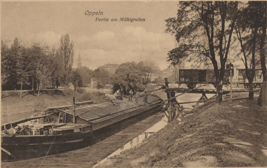
Oppeln Partie am Mühlgraben