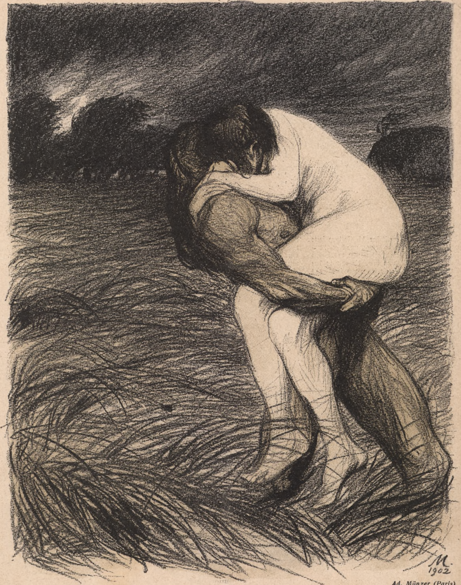
Das verlorene Paradies