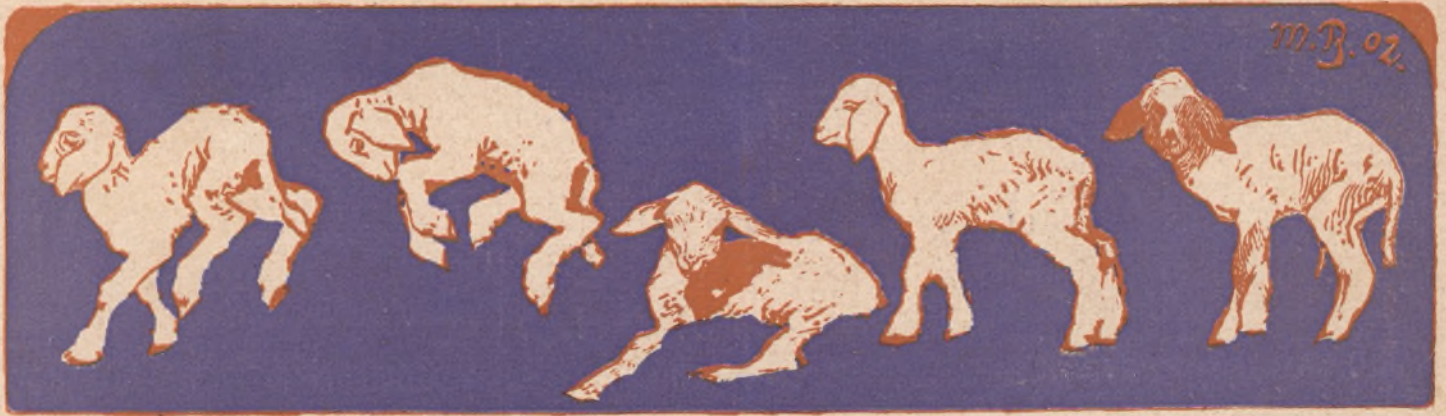
Max Bernuth (München)