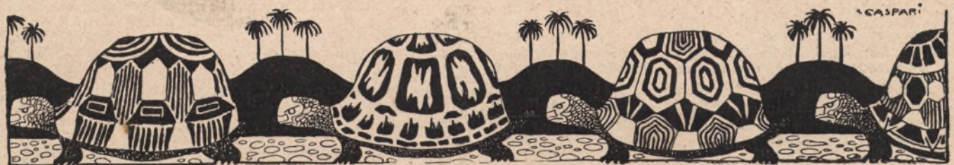
God save the King!

A.: „Was sagst Du zu den Berner Studenten?“ B.: „Ganz unnütze Aufregung! Daß sich die Schweizer mit den Deutschen verwandt fühlen, ging doch schon daraus hervor, daß sie nach Nürnberg einen — Wetter entsandten.“