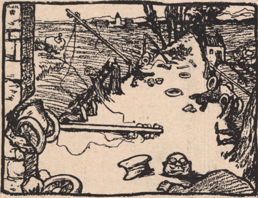
Paris - Wien