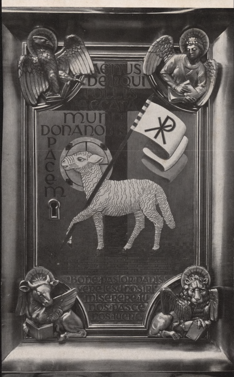
AUGUST WITTE-AACHEN TÜRE AM TABERNAKEL IM DOM ZU BRESLAU