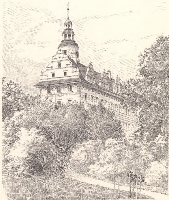
LEITUNG: H. LUTSCH