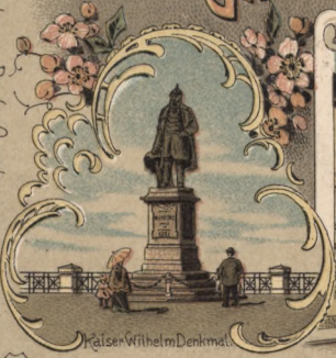
Kaiser Wilhelm Denkmal.