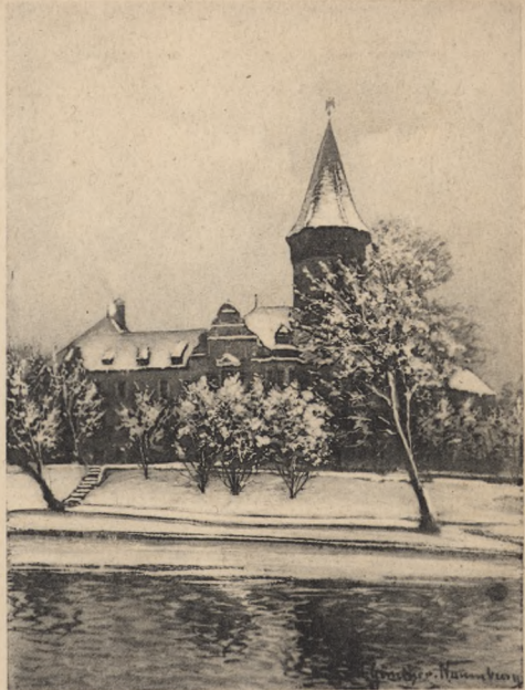
Königl. Regierung - Oppeln