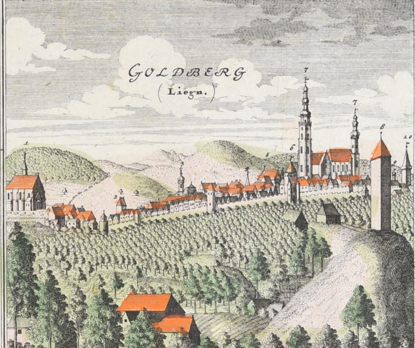
1. Begräbnus Kirche 2. Die wider Thor 3. Franciscaner Closter 4. Bittel Thurm 5. Rath Haus 6. Sülzer Thor 7. Pfarr. Kirche 8. Wasser Thurm 9. Die Schule 10. Obere Thor