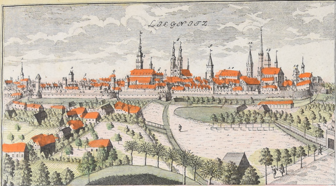
1. Franciscaner Kirche 2. S. S. Peter u. Paul Pfarr. Kirche 3. Kugelf. Ritter. Academie 4. Klagische Thor 5. Die Pforte 6. S. S. Peter u. Paul Pfarr. Kirche 7. Rath Haus 8. Jesuiten zu S. Johann 9. S. Michaels Thurm am Schloß 10. Fürstl. Schloß 11. S. Peters Thurm am Schloß 12. S. Johann Nepomuc. Kirche 13. Frauen Kirche 14. Breslauer Thor 15. Frauen Closter ad S. 16. Das obere Thor