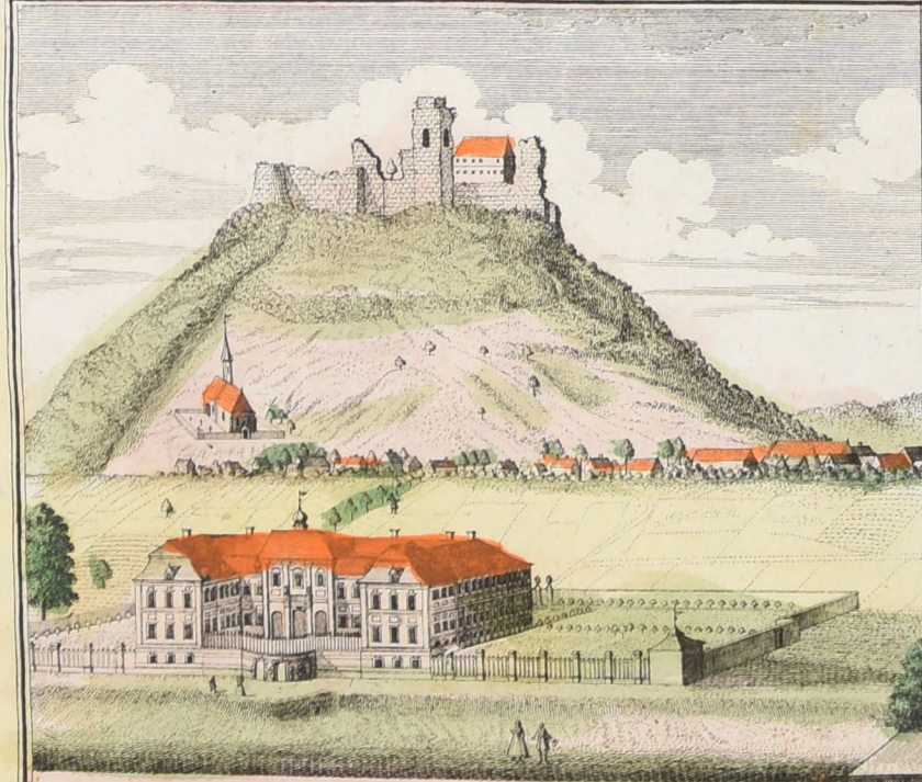
GRADITZBERG [Liegn.] mit dem neuen darunter gelegenen Gräfl. Frankenberg. Schloß.

SCENOGRAPHIA URBIUM SILESIÆ TAB. V VORSTELLUNG e der PROSPECTE von den vornehmsten Städten der Fürstenth. LIEGNITZ u. TESCHEN im Herzogth. SCHLESSEN entworfen von F. B. Werner u. herausgegeben von HOMANNISCHEN ERBEN Nürnberg A. 1738 Mit Kayf. allergnädigste Privilegio