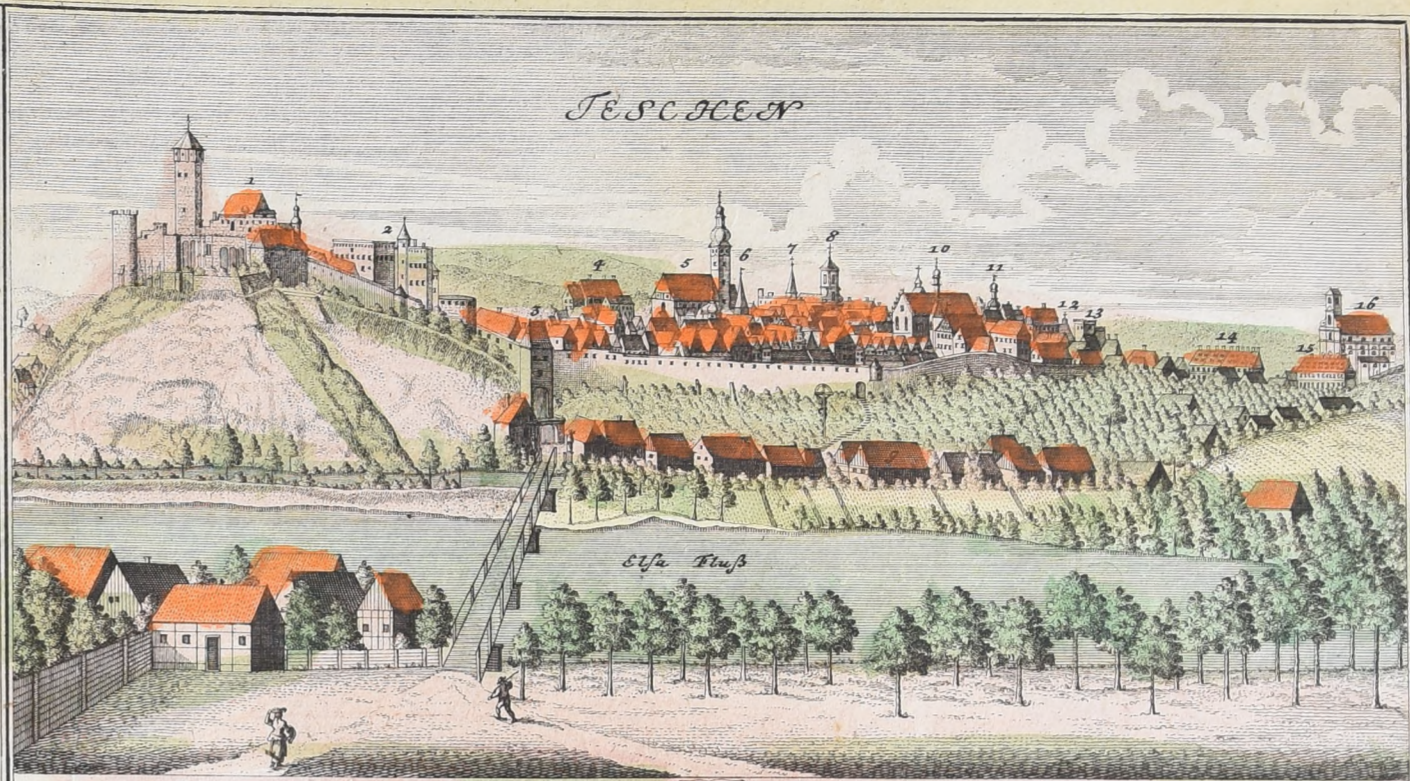
1. Das obere od. alte Schloß 2. Das untere Schloß 3. Wasser Thor 4. Gräfl. Mantuffl. Haus 5. Die Pfarr. Kirche 6. Der Glocken Thurm 7. Begräbnus Kirchel. 8. Barmherzige Brüder 9. Die Mühlen 10. P.P. Dominicaner 11. Rath Haus 12. P.P. Jesuiten Residenz 13. Das obere Thor 14. Luther. Pfarr. Häuser 15. Die Schule 16. Luther-Gnaden Kirche