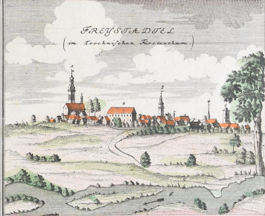
1. Die Pfarr. Kirche 2. Das Schloß 3. Rath Haus 4. Begräbnus Kirchel. 5. Das Teschner Thor 6. Der Elbe Fluß