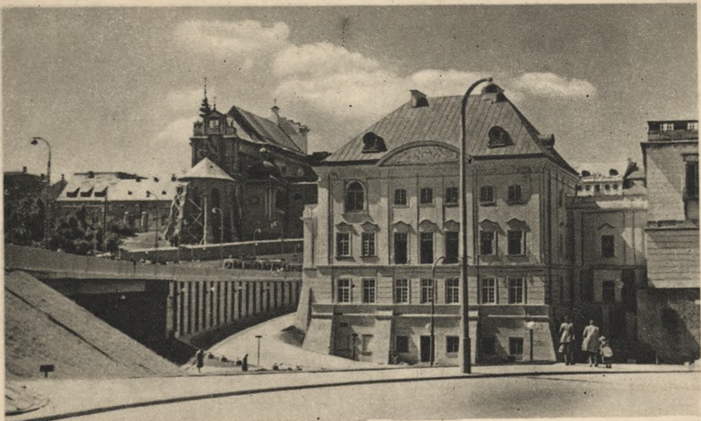
WARSZAWA — Pałac pod Blachą od strony wschodniej.