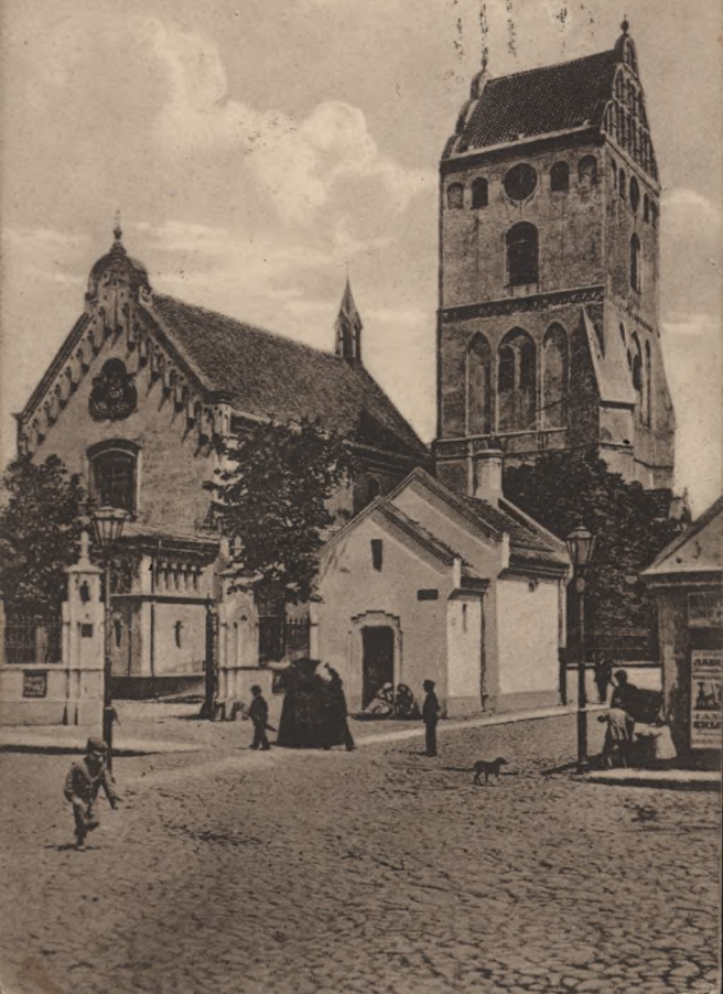
Warszawa. Kościół p. Maryi.