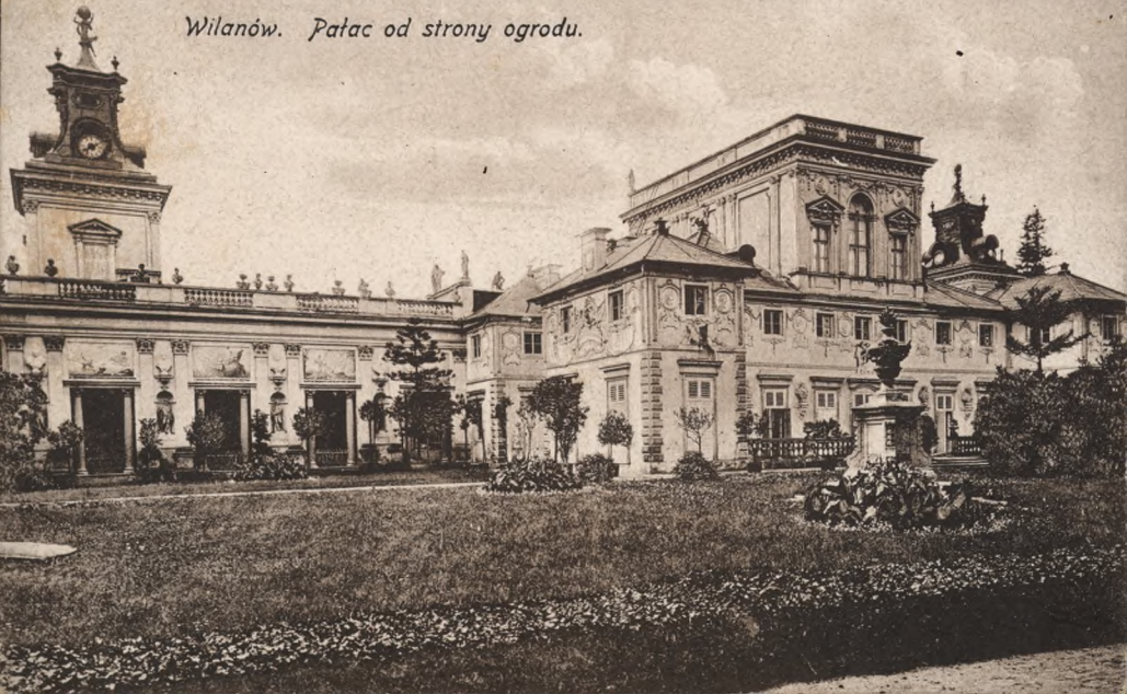
Wilanów. Pałac od strony ogrodu.