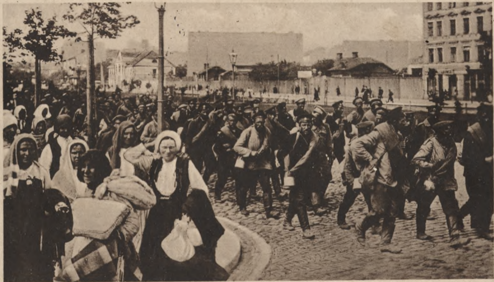
Ein russisches Armierungs-Bataillon verläßt Warschau kurz vor der Einnahme durch deutsche Truppen