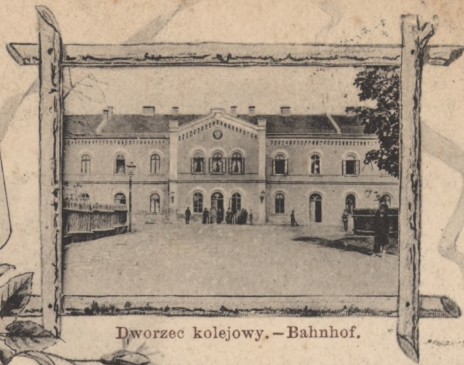
Dworzec kolejowy. — Bahnhof.