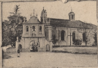
rz. kat. Kościół. — Röm.-kath. Kirche.

Pozdrowienie z Chodorowa. Gruss aus Chodorow 1874