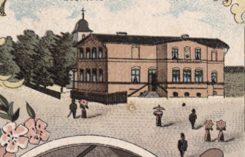
Pfarrkirche u. Schule