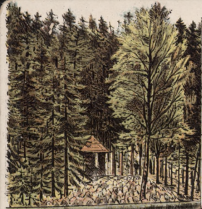
Fischerhaus in Buk.