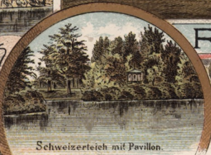
Schweizerteich mit Pavillon.