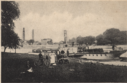
Dampfer „C. W. IV“. 6/11 00,