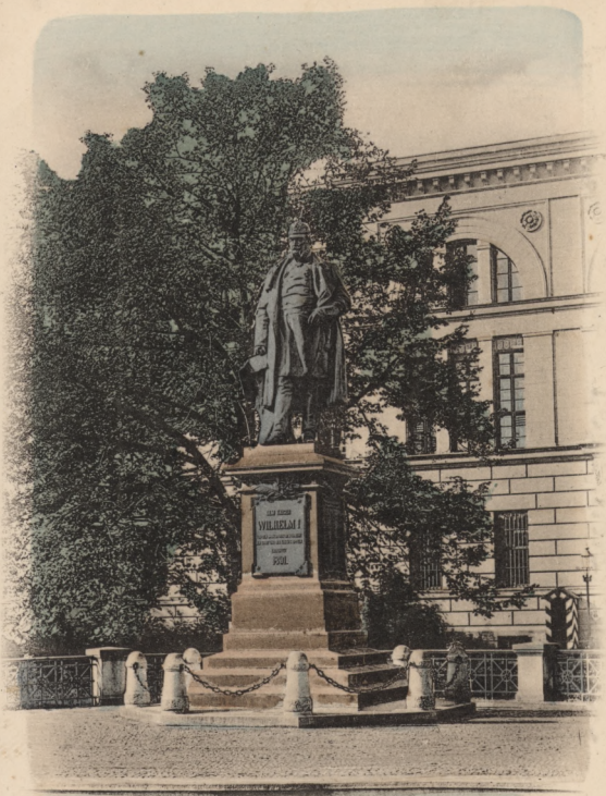
Denkmal Kaiser Wilhelm I.