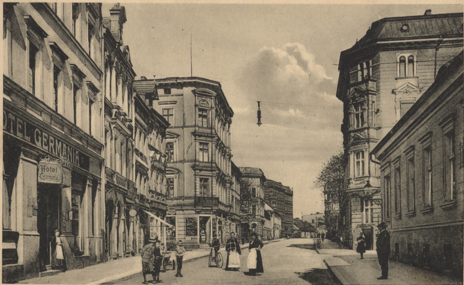
Oppeln - Malapanerstraße