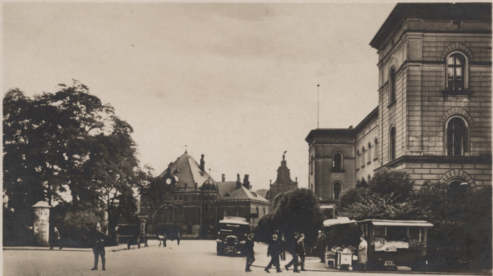
OPPELN, Bahnhof u. Oberpostdirektion.