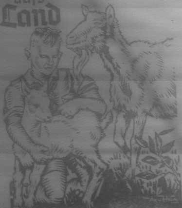
1250 Kinderland Beschickung

Die Reichsteilung des NSLB. Bayreuth erteilt über Hawemann-Knoff-Wagner