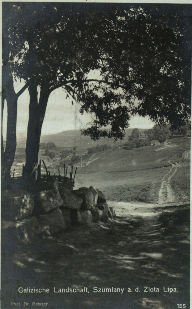
Galizische Landschaft, Szumlany a. d. Zlota Lipa.