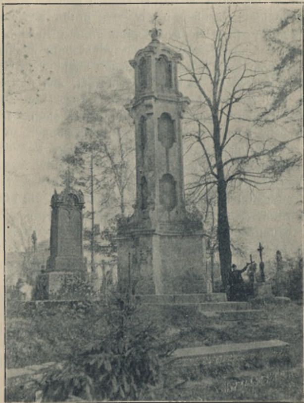
Kolumna na pamiątkę koronacji obrazu Matki Boskiej (w r. 1751).