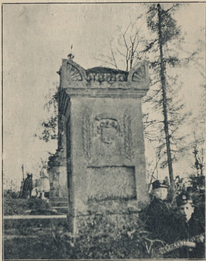
Nagrobek bez napisu (z pierwszej połowy XIX. w.).

Dziwnego doznaje się uczucia, czytając te niemieckie napisy na grobach najpoważniejszych mieszczan lwowskich z pierwszej połowy XIX. wieku. Zdaje się, jakoby Lwów wówczas zupełnie był niemieckim. Nawet sentencje, niekiedy wierszowane, noszą na sobie wszelkie cechy sentymentalizmu Bieder-