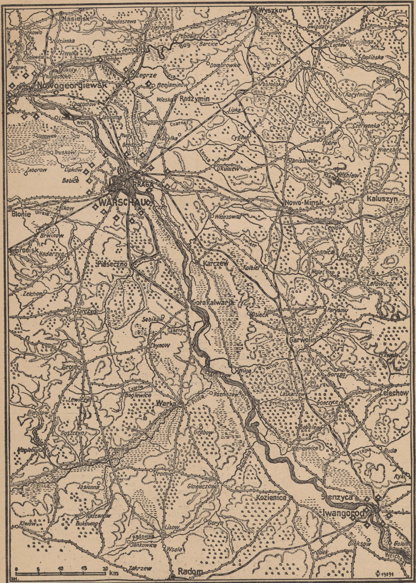
Bei den Kämpfen in Polen — Die Weichsellinie von Warschau bis Zwangerod