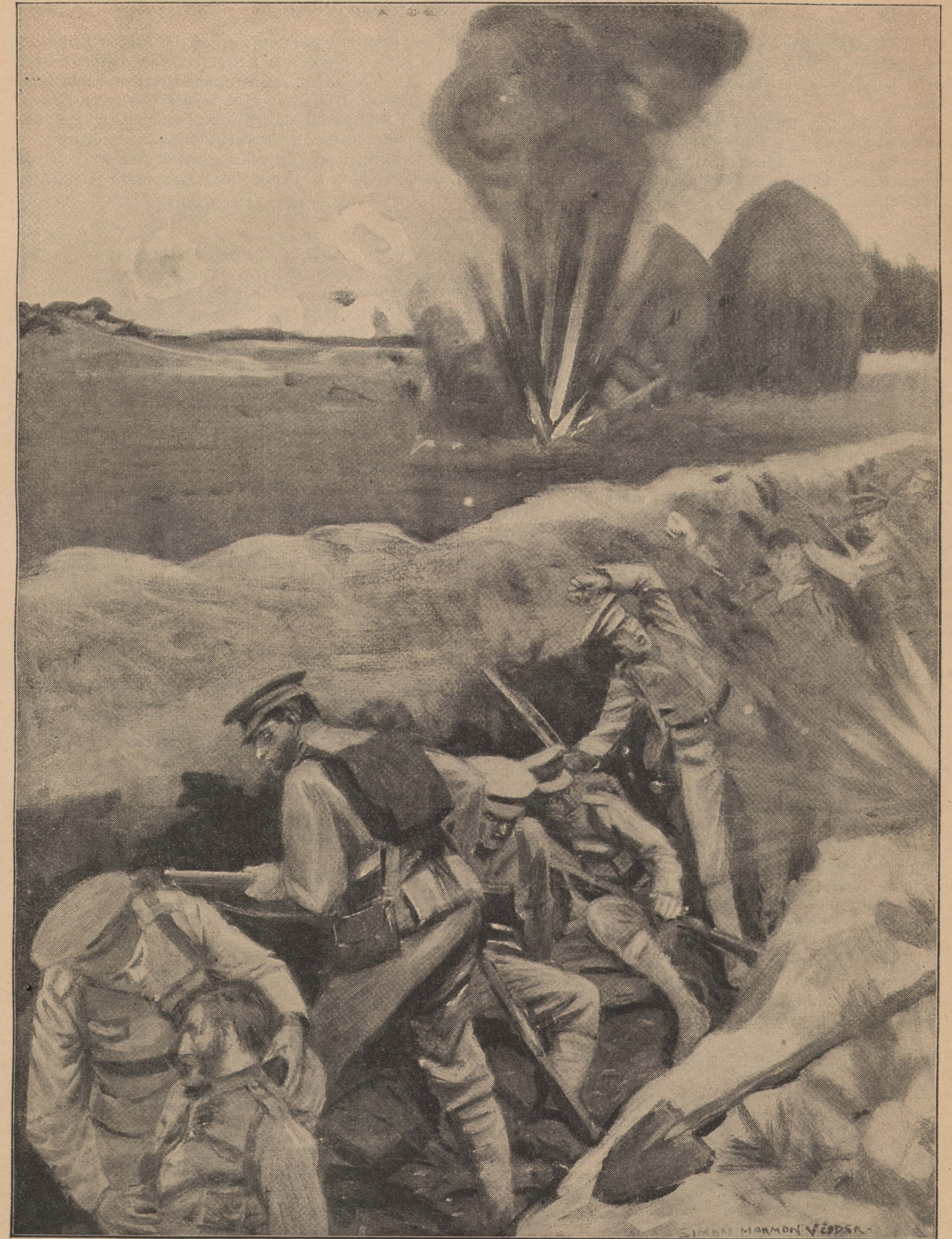
Die Wirkung der schweren deutschen Geschütze in einem Schützengraben der Engländer

Das englische Unterseeboot „E 3“ ist am 18. Oktober nachmittags in der deutschen Bucht der Nordsee vernichtet worden. — Der stellv. Chef des Admiralstabes.