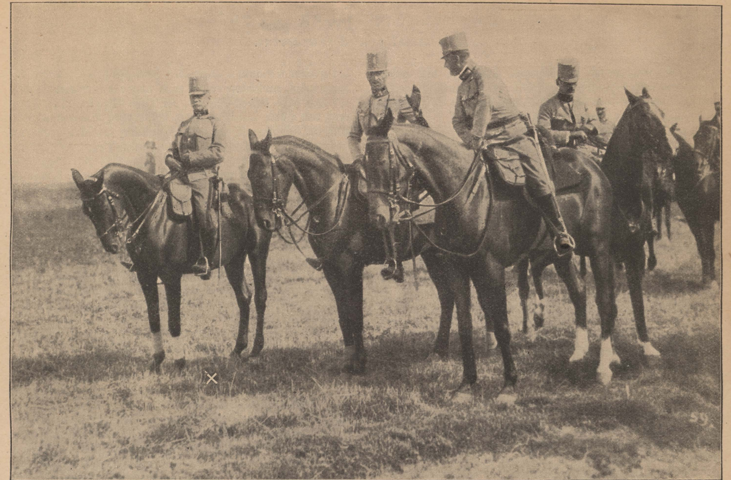
Der Generalstabschef des Ostens: Baron Conrad v. Hötzendorf

„Es war schauerlich; an der Stelle, wo die Russen den Einbruch versucht hatten, lagen auf ganz engem Raum mindestens fünfhundert Leichen kreuz und quer übereinander. Vor einem Hindernis waren sie so dicht hingestreckt, daß man buchstäblich die Erde nicht sah. Irgendwo hat das Glacis zwei Stufen; in die vermeintlichen toten Räume dieser Stufen flüchteten Hunderte von Unglücklichen vor dem rasenden Frontalfeuer unserer Maschinengewehre, und wußten nicht, daß sie sich gerade da der Enfilierung durch andere Maschinengewehre aussetzten. In Sekunden waren die Stufen von zuckenden Menschenleibern ausgefüllt. Es war ein Panoptikum, wie sich's keine menschliche Phantasie trasser vorstellen kann. Da lag einer auf dem Rücken mit gekrümmten Armen über sich, als hielt er noch das Gewehr im Anschlag, wie im Augenblick des Sterbens. Ein anderer hatte eben eine Wöschung erstiegen, klammerte sich mit beiden Händen am oberen Rand fest und hob den Kopf, da ereilte ihn das Geschloß und ließ ihn in der sonderbaren Haltung erstarren. Man mußte ganz nahe herantreten, den Mann berühren, um zu glauben, daß er wirklich tot sei. Einer lag ohne Kopf und Arme da, einer lächelnd mit abgetragener Schädelschale und leerer Hirnschale, mit den Telephonmuskeln noch an den Ohren. Leute, die, vom Scheinwerfer geblendet, die Augen