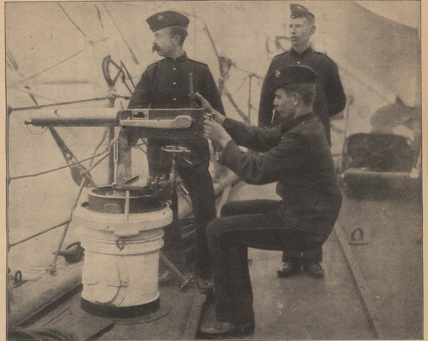
An Bord eines englischen Kriegsschiffs — Maschinengewehr in Tätigkeit

eine für den Gebirgskrieg besonders ausgebildete Truppe, mit der in den Vogesen schwere Kämpfe auszufechten waren