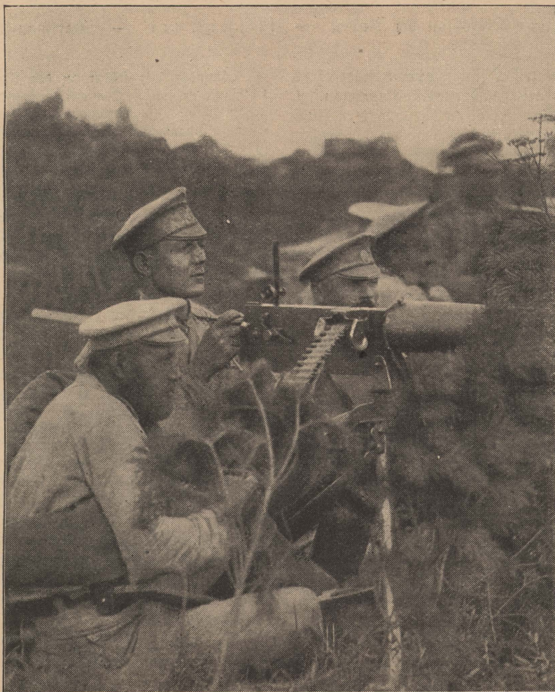
Russisches Maschinengewehr in Deckung

war ein Symbol, und in London und Paris, wo man jetzt das hohe Lied vom Zaren singt, ertönte in allen Gassen der polnische Freiheitslied: „Noch ist Polen nicht verloren“. Damals hatte man noch im englischen Parlament und in der französischen Kammer das Gefühl, daß die Bedrohung durch das Moskowitertum die größte und schwerste Gefahr für Europa bilde. Man feierte die Helden der polnischen Insurrektion, weil man in ihnen Vorkämpfer des Westens sah, die in tollkühner Tapferkeit, ein ganzes Heer von Winkelrieden, der Freiheit eine Gasse bahnten. Und als nach blutigem Kampf Praga von den Zarenheeren erstürmt, als Warschau gefallen und der Rest polnischer Freiheit zertreten war, ging ein Weinen durch die Welt, ein Schrei des Mitleids und des Entsetzens, und