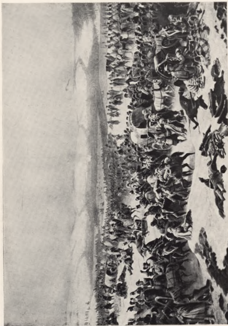
PRZEJŚCIE ARMII NAPOLEONA PRZEZ BEREZYNĘ 1812 R.