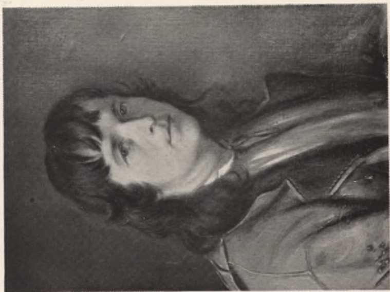
Galeria Narodowa m. Lwowa