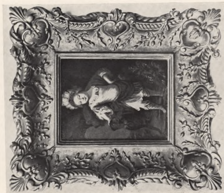
KRÓLEWICZ ALEKSANDER SOBIESKI