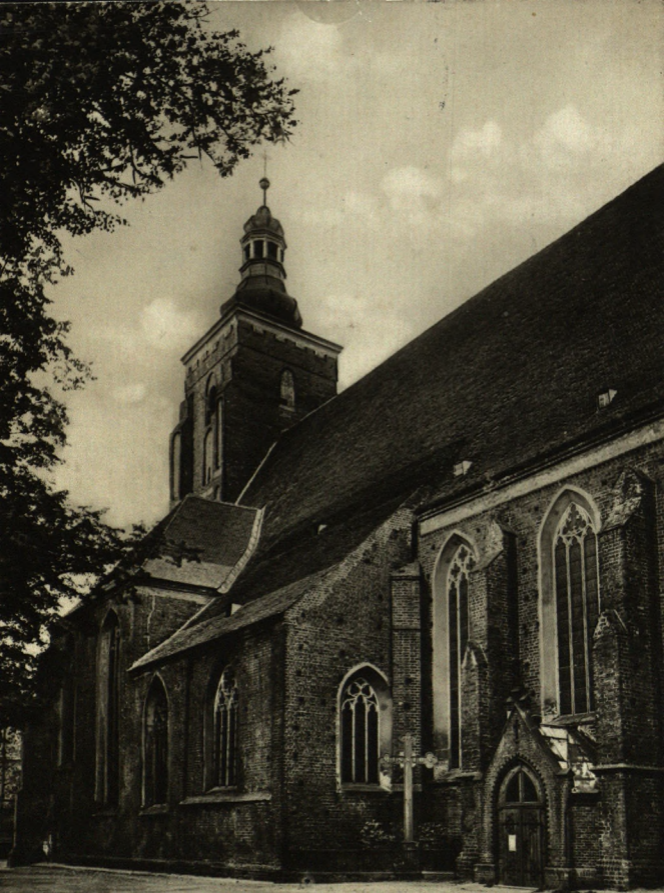
Namslau i. Schles., Kath. Kirche.