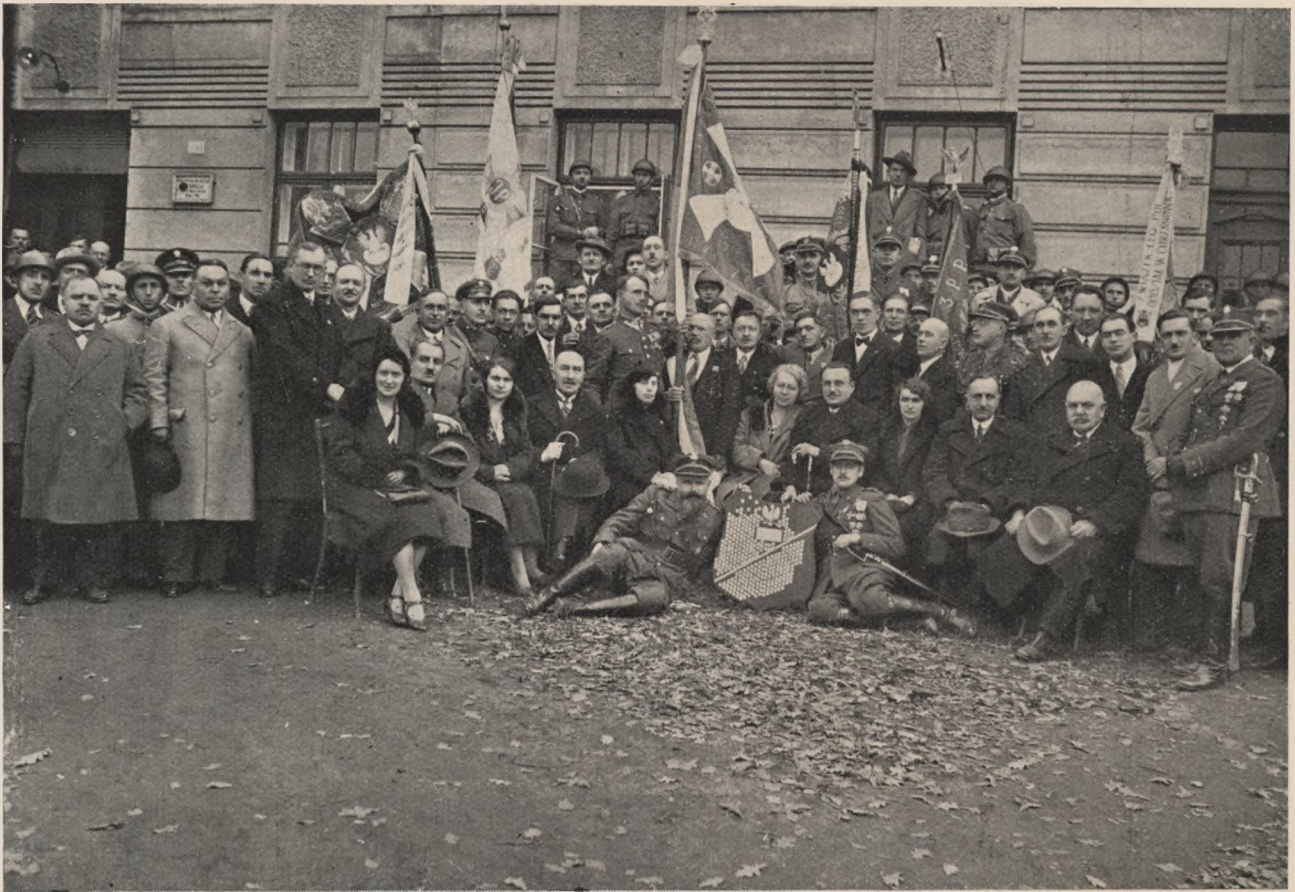
Z uroczystości poświęcenia sztandaru Oddziału Związku Legionistów Polskich w Brzeszczach.