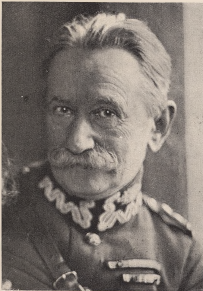
Śp. ppłk. Artur Oppman (Or-Ot). Piewca chwały i czynów żołnierskich.

Przez pięć lat redagował „Żołnierza Polskiego“.