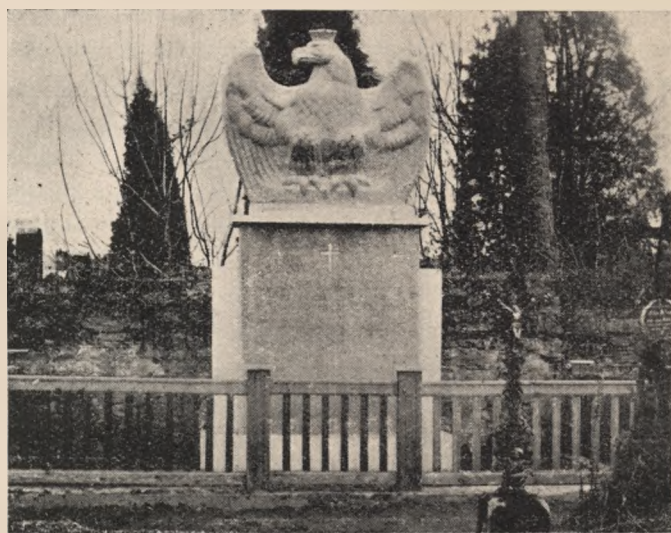
Pomnik na grobie Legionistów w Jablonkowie na Śląsku cieszyńskim w Czechosłowacji.