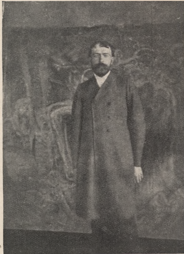
Mało znana fotografia Stanisława Wyspiańskiego, wykonana w pracowni poety przy ul. Krowoderskiej w Krakowie w 1904 r.

To też w myśl tej rewolucyjnej zasady i w myśl wspomnianej już modlitwy Konrada rozwinięta z końcem aktu II proklamacja walki orężnej , którą głosi Hestja, bogini ogniska domowego, naznaczając Konrada na chorążego Czynu, była dla nas, pokolenia przedwojennego, istotnym wezwaniem do czynu, które swój oddźwięk już rychło znalazło w pierwszych poczynaniach bojowych z r. 1904 — 1905 i późniejszych pracach niepodległościowo-strzeleckich, podjętych na rozkaz Józefa Piłsudskiego.