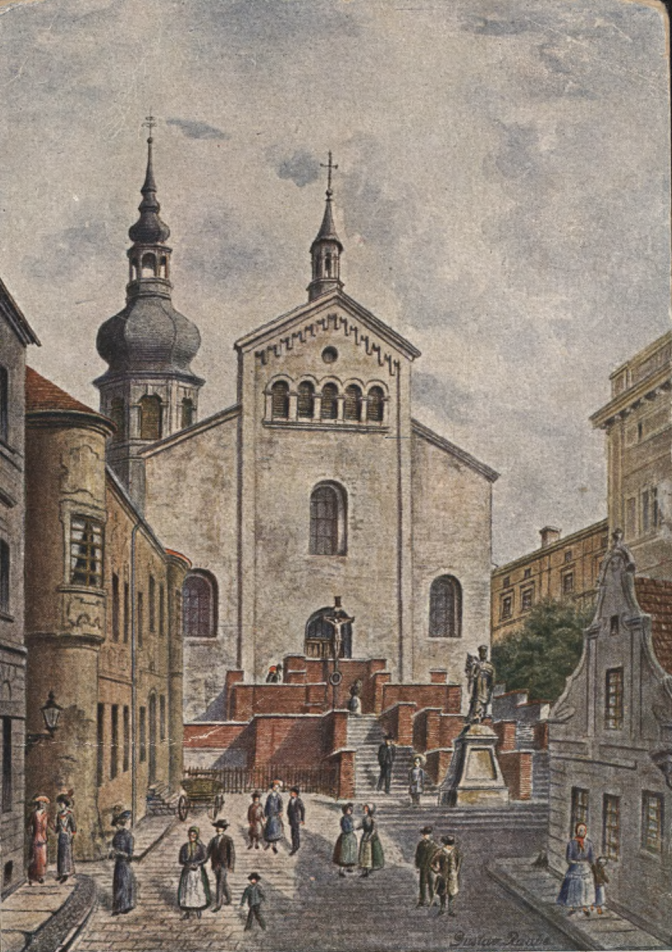
Duppeln. St. Adalbert-Kirche und Hospital.