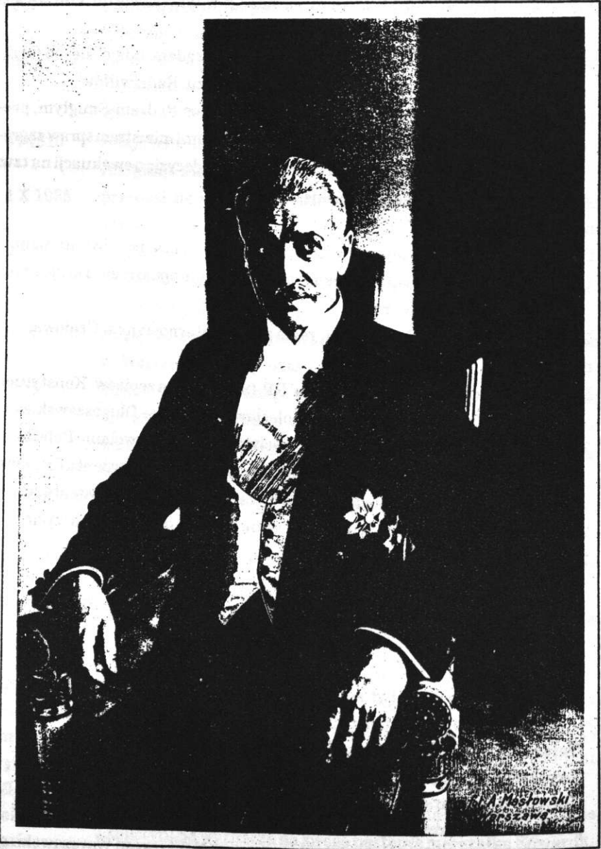
IGNACY MOŚCICKI III Prezydent Rzeczypospolitej.