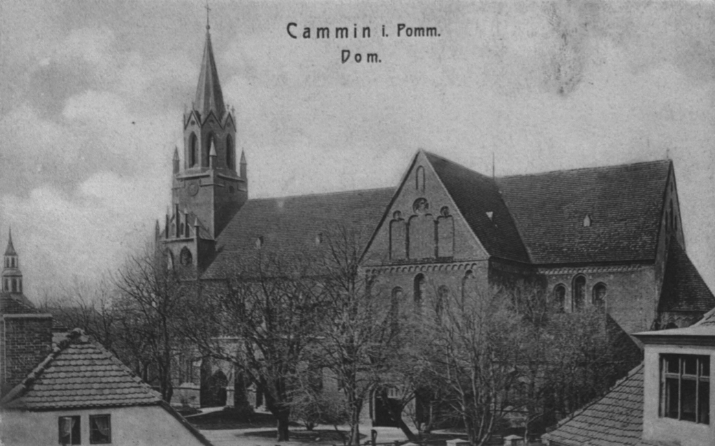
Cammin i. Pomm. Dom.