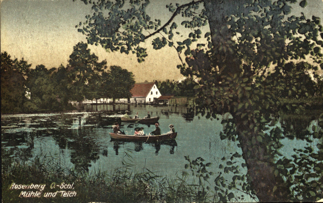
Rosenberg O.-Schl. Mühle und Teich