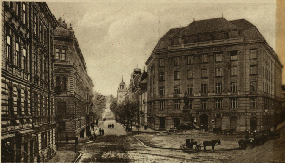
Lwów. Ulica Mickiewicza i pomnik Smolki. - Lemberg. Mickiewicz-Gasse u. Smolka Monument.