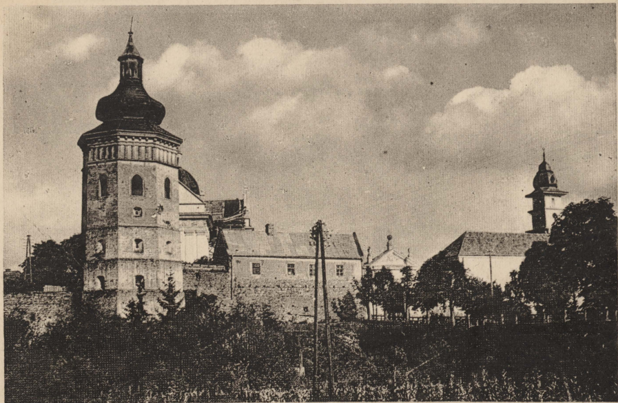
ŻÓLKIEW. Widok z ul. Piłsudskiego na fortyfikacje miasta, basztę obronną, bramę glińską i Ratusz.