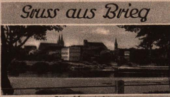
Blick über die Oder