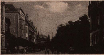
Priesterstraße, Blick zur Post