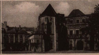
Priesterhof-Portal u. Heiligenskirche