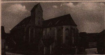
Reste des ehemaligen Mönchensklöster