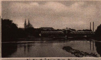
Die Oderbrücke m. Kath. Kirche